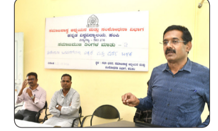
ಇಲ್ಲದೇನೆ ನಿಮ್ಮ ಸಂಶೋಧನೆಯನ್ನು ಪೂರ್ಣಗೊಳಿಸಬಹುದು. ಕಲಿಕೆ ಮುಕ್ತವಾದ ವೇದಿಕೆ ಇದೆ. ಕಲಿಯಲು ಸಮಯ ಕೊಡಬೇಕು ಅಷ್ಟೇ. ಅನೇಕ ಯುವಕರು ಇದರಿಂದ ತಮ್ಮ ಜೀವನವನ್ನು ಕಟ್ಟಿಕೊಂಡಿದ್ದಾರೆ ಎಂದು ತಮ್ಮ ಅನುಭವಗಳ ಜೊತೆ ವ್ಯಕ್ತಪಡಿಸಿದರು. ಕಂಪ್ಯೂಟರ್ ಇಲ್ಲದ ಕಾಲದಲ್ಲಿ ಕೈಯಲ್ಲಿ ಬರೆದ ಅಂಕಿ ಅಂಶಗಳು ಪ್ರಸ್ತುತ ದತ್ತಾಂಶಗಳಿಗೆ ಹೋಲಿಕೆ ಆಗುತ್ತಿರಲಿಲ್ಲ. ಇದರಿಂದ ಸಂಶೋಧನೆಯಲ್ಲಿ