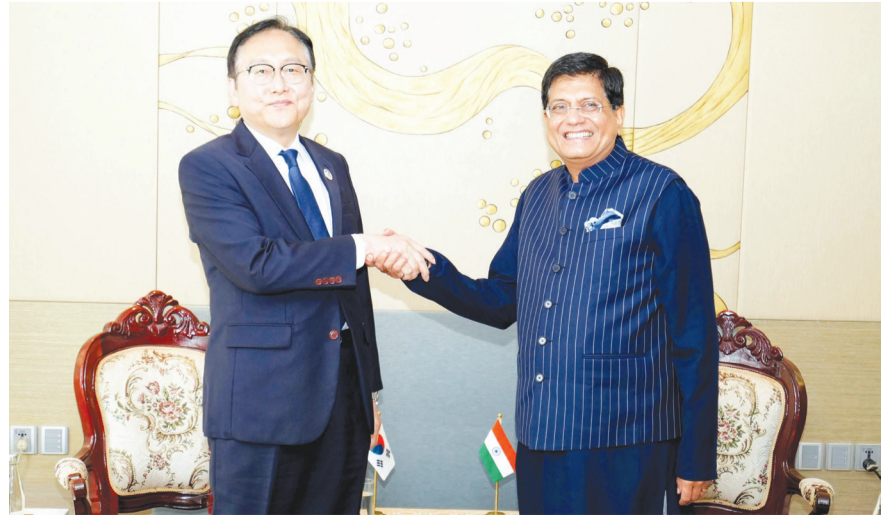
ವಾಣಿಜ್ಯ ಮತ್ತು ಕೈಗಾರಿಕಾ ಸಚಿವ ಪಿಯೂಷ್ ಗೋಯಲ್ ಅವರು ಕೊರಿಯಾ ಗಣರಾಜ್ಯದ ವ್ಯಾಪಾರ, ಕೈಗಾರಿಕೆ ಮತ್ತು ಇಂಧನ ಸಚಿವ ಇಂಕ್ವೊ ಚಿಯೋಂಗ್ ಅವರೊಂದಿಗೆ ಲಾಪೋಸ್‌ನ ವಿಶೇಷ ಸಭೆಯಲ್ಲಿ ಶನಿವಾರ ಮಾತುಕತೆ ನಡೆಸಿದರು.