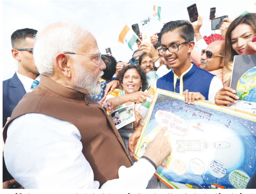
ಫಿಲಿಡೆಲ್ಯಿಯಾ ಅಂತಾರಾಷ್ಟ್ರೀಯ ವಿಮಾನ ನಿಲ್ದಾಣಕ್ಕೆ ಶನಿವಾರ ಆಗಮಿಸಿದ ಪ್ರಧಾನಿ ನರೇಂದ್ರ ಮೋದಿ ಅವರನ್ನು ಭಾರತೀಯ ವಲಸಿಗರು ಆತ್ಮೀಯವಾಗಿ ಬರಮಾಡಿಕೊಂಡರು.

ಎಂದು ಪೀಠದ ಮೂರನೇ ನ್ಯಾಯಾಧೀಶರು ಅಭಿಪ್ರಾಯಪಟ್ಟಿದ್ದಾರೆ. ಸ್ಟ್ಯಾಂಡ್-ಅಪ್ ಕಾಮಿಡಿಯನ್ ಕುನಾಲ್ ಕಮ್ಲಾ, ಎಡಿಟರ್ಸ್ ಗಿಲ್ಡ್ ಆಫ್ ಇಂಡಿಯಾ, ನ್ಯೂಸ್ ಬ್ರಾಡ್‌ಕಾಸ್ಟ್ ಮತ್ತು ಡಿಜಿಟಲ್ ಅಸೋಸಿಯೇಷನ್ ಮತ್ತು ಅಸೋಸಿಯೇಷನ್ ಆಫ್ ಇಂಡಿಯನ್ ಮ್ಯಾಗಜೀನ್‌ಗಳು ಹೊಸ ನಿಯಮಾವಳಿ ಪ್ರತಿಭೆ ಬಾಂಬೆ ಹೈಕೋರ್ಟ್‌ಗೆ ಅರ್ಜಿ ಸಲ್ಲಿಸಿದ್ದವು. ಸರ್ಕಾರಕ್ಕೆ ಸಂಬಂಧಿಸಿದ ತಪ್ಪು ದಾರಿಗಳೆಂದು ಅಥವಾ ತಪ್ಪು ಅನ್ವಯ ವಿಷಯವನ್ನು ಫ್ಲಾಗ್ ಮಾಡುವ ಅಧಿಕಾರವನ್ನು ಹೊಂದಿರುವ ಎಫ್ಐಯು ಸ್ಥಾಪನೆಯು ವಿವಾದದ ಕೇಂದ್ರವಾಗಿದೆ. ನಿಯಮಗಳು ಮೂಲಭೂತ ಹಕ್ಕುಗಳ ಮೇಲೆ ತಣ್ಣನೆಯ ಪರಿಣಾಮವನ್ನು ಬೀರುತ್ತವೆ ಎಂಬ ಅರ್ಜಿದಾರರ ವಾದವನ್ನು ನ್ಯಾಯಾಲಯವು ಒಪ್ಪಿಕೊಂಡಿತು. ಏಕ ನ್ಯಾಯಾಧೀಶರು ತಮ್ಮ ತೀರ್ಪಿನಲ್ಲಿ, ನಿಯಮ 3(1)(ಬಿ)(5) ವಿಧಿ 19(1)(ಎ) ಅಡಿಯಲ್ಲಿ ಖಾತರಿಪಡಿಸಿದ ಮೂಲಭೂತ ಹಕ್ಕನ್ನು ನಿರ್ಬಂಧಿಸಲು ಪ್ರಯತ್ನಿಸಿದರು. ಸಂವಿಧಾನದ ಅರ್ಟಿಕಲ್ 19(2) ಗೆ ಹೊಂದಿಕೆಯಾಗದ ನಿರ್ಬಂಧಗಳನ್ನು ಹಾಕಲು ಪ್ರಯತ್ನಿಸಿದರು. ಅರ್ಟಿಕಲ್ 19(1)(ಎ) ವಾಕ್ ಮತ್ತು ಅಭಿವ್ಯಕ್ತಿ ಸ್ವಾತಂತ್ರ್ಯವನ್ನು ನೀಡಿದರೆ, ಅರ್ಟಿಕಲ್ 19(2) ಸರ್ಕಾರ ಅಥವಾ ಶಾಸಕಾಂಗವು ಈ ಸ್ವಾತಂತ್ರ್ಯದ ಮೇಲೆ ವಿವಿಧ ಅಧಾರದ ಮೇಲೆ ಸಮಂಜಸವಾದ ನಿರ್ಬಂಧಗಳನ್ನು ವಿಧಿಸಲು ಅನುಮತಿಸುತ್ತದೆ.