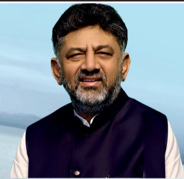
ಶ್ರೀ ಡಿ.ಕೆ. ಶಿವಕುಮಾರ್ ಮಾನ್ಯ ಉಪಮುಖ್ಯಮಂತ್ರಿಗಳು