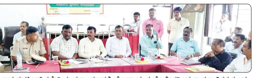
ಬಸವಕಲ್ಯಾಣದ ತಹಶೀಲ್ ಕಚೇರಿಯ ಸಭಾಂಗಣದಲ್ಲಿ ಲೋಕಾಯುಕ್ತ ಪೊಲೀಸರಿಂದ ಸಾರ್ವಜನಿಕರ ಕುಂದು ಕೊರತೆಗಳು ಹಾಗೂ ಅಪವಾಲು ಸ್ವೀಕಾರ ನಡೆಯಿತು.

ಬಸವಕಲ್ಯಾಣ, ಸೆ. 21- ಇಲ್ಲಿಯ ತಹಶೀಲ್ ಕಚೇರಿಯ ಸಭಾಂಗಣದಲ್ಲಿ ಲೋಕಾಯುಕ್ತ ಪೊಲೀಸರು ಸಾರ್ವಜನಿಕರ ಕುಂದು ಕೊರತೆಗಳ ಹಾಗೂ ಅಪವಾಲು ಸ್ವೀಕರಿಸಿದರು. ವಿವಿಧ ಸಾರ್ವಜನಿಕರ ತಮ್ಮ ದೂರುಗಳನ್ನು ಲೋಕಾ ಅಧಿಕಾರಿಗಳಿಗೆ ಸಲ್ಲಿಸಿದರು. ಸ್ಥಳದಲ್ಲಿಯೇ ಅಧಿಕಾರಿಗಳ ಸಮ್ಮುಖದಲ್ಲಿ ಕೆಲ ಅರ್ಜಿಗಳ ಇತ್ಯರ್ಥ ಪಡಿಸಿದರು. ಅಪವಾಲು ಸ್ವೀಕಾರ ಹಿನ್ನೆಲೆಯಲ್ಲಿ ವಿವಿಧ ಇಲಾಖೆಯ ತಾಲ್ಲೂಕು ಮಟ್ಟದ ಅಧಿಕಾರಿಗಳು ಭಾಗವಹಿಸಿದ್ದರು. ಅಧಿಕಾರಿಗಳು ಕಚೇರಿಗೆ ಬಂದ ನಂತರ ಕಚೇರಿಯ ಸಮಯದಲ್ಲಿ ಯಾವುದೇ ಕಾರಣಕ್ಕೂ ದ್ವಾರಗಳು ಬಂದ್ ಮಾಡಿ ಕೂಡಬೇಡಿ. ಇಂತಹ ವರದಿಗಳು ನಮ್ಮ ಗಮನಕ್ಕೆ ಬಂದಿವೆ. ಸಾರ್ವಜನಿಕರ ಕುಂದು ಕೊರತೆಗಳ ಅರ್ಜಿಗಳನ್ನು ಹಿಡಿದು ಕೊಂಡು ನಿತ್ಯ ಕಚೇರಿಗೆ ಬರುತ್ತಾರೆ.