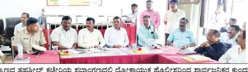
ಬಸವಕಲ್ಯಾಣದ ತಹಶೀಲ್ ಕಚೇರಿಯ ಸಭಾಂಗಣದಲ್ಲಿ ಲೋಕಾಯುಕ್ತ ಪೊಲೀಸರಿಂದ ಸಾರ್ವಜನಿಕರ ಕುಂದು ಕೊರತೆಗಳು ಹಾಗೂ ಅಪವಾಲು ಸ್ವೀಕಾರ ನಡೆಯಿತು.

ಬಸವಕಲ್ಯಾಣ, ಸೆ.21- ಇಲ್ಲಿಯ ತಹಶೀಲ್ ಕಚೇರಿಯ ಸಭಾಂಗಣದಲ್ಲಿ ಲೋಕಾಯುಕ್ತ ಪೊಲೀಸರು ಸಾರ್ವಜನಿಕರ ಕುಂದು ಕೊರತೆಗಳ ಹಾಗೂ ಅಪವಾಲು ಸ್ವೀಕರಿಸಿದರು. ವಿವಿಧ ಸಾರ್ವಜನಿಕರ ತಮ್ಮ ದೂರುಗಳನ್ನು ಲೋಕಾ ಅಧಿಕಾರಿಗಳಿಗೆ ಸಲ್ಲಿಸಿದರು. ಸ್ಥಳದಲ್ಲಿಯೇ ಅಧಿಕಾರಿಗಳ ಸಮ್ಮುಖದಲ್ಲಿ ಕೆಲ ಅರ್ಜಿಗಳ ಇತ್ಯರ್ಥ ಪಡಿಸಿದರು. ಅಪವಾಲು ಸ್ವೀಕಾರ ಹಿನ್ನೆಲೆಯಲ್ಲಿ ವಿವಿಧ ಇಲಾಖೆಯ ತಾಲ್ಲೂಕು ಮಟ್ಟದ ಅಧಿಕಾರಿಗಳು ಭಾಗವಹಿಸಿದ್ದರು. ಅಧಿಕಾರಿಗಳು ಕಚೇರಿಗೆ ಬಂದ ನಂತರ ಕಚೇರಿಯ ಸಮಯದಲ್ಲಿ ಯಾವುದೇ ಕಾರಣಕ್ಕೂ ದ್ವಾರಗಳು ಬಂದ್ ಮಾಡಿ ಕೂಡಬೇಡಿ. ಇಂತಹ ವರದಿಗಳು ನಮ್ಮ ಗಮನಕ್ಕೆ ಬಂದಿವೆ. ಸಾರ್ವಜನಿಕರ ಕುಂದು ಕೊರತೆಗಳ ಅರ್ಜಿಗಳನ್ನು ಹಿಡಿದುಕೊಂಡು ನಿತ್ಯ ಕಚೇರಿಗೆ ಬರುತ್ತಾರೆ. ನೀವು