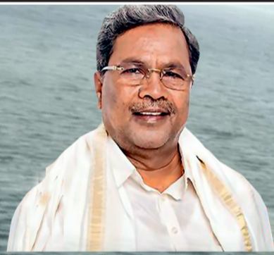
ಶ್ರೀ ಸಿದ್ದರಾಮಯ್ಯ ಸನ್ಮಾನ್ಯ ಮುಖ್ಯಮಂತ್ರಿಗಳು

ConstitutionGok https://www.democracydaykarnataka.in 9482 300 400