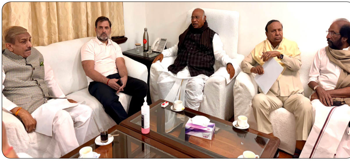
ವಿರೋಧ ಪಕ್ಷದ ನಾಯಕ ರಾಮ್‌ಗಾಂಧಿ ಮತ್ತು ಇಂಡಿಯಾ ಮೈತ್ರಿಕೂಟದ ಸಂಸದೀಯ ನಾಯಕರು, ಎಬಿಸಿ ಅಧ್ಯಕ್ಷ ಮಲ್ಲಿಕಾರ್ಜುನ ಖರ್ಗೆ ಅವರ ದೆಹಲಿಯ ಗೃಹಚೀರಿಯಲ್ಲಿ ಆಯೋಜಿಸಲಾಗಿದ್ದ ಸಭೆಯಲ್ಲಿ ಭಾಗವಹಿಸಿದ್ದರು.

ಭಾವಿಸುತ್ತೇವೆ. ಕದನ ವಿರಾಮ ಒಪ್ಪಂದದ ಪ್ರಕಾರ ಇಸ್ರೇಲ್ ಪಡೆಗಳು ದಕ್ಷಿಣ ಲೆಬನಾನ್ನಿನಿಂದ ತನ್ನ ಸೇನೆಯನ್ನು ಹಿಂತೆಗೆದುಕೊಳ್ಳಬೇಕು. ಆ ಪ್ರದೇಶದಲ್ಲಿ ಲೆಬನಾನ್ ತನ್ನ ಸೇನೆಯನ್ನು ನಿರೋಧಿಸಬೇಕು. ಒಪ್ಪಂದವು ಇತರ ಯಾವುದೇ ಭಯೋತ್ಪಾದಕ ಸಂಘಟನೆಗಳು ಇಸ್ರೇಲ್‌ನ ಭದ್ರತೆಗೆ ಬೆದರಿಕೆ ಹಾಕಲು ಅನುಮತಿಸುವುದಿಲ್ಲ ಎಂದು ಹೇಳಿದ್ದಾರೆ. ಲೆಬನಾನಿನ ವಿದೇಶಾಂಗ ಸಚಿವ ಅಬ್ದುಲ್ಲಾಹ್ ಹಬೀಬ್ ಮಾತನಾಡಿ, ಇಸ್ರೇಲ್ ಪಡೆಗಳು ತನ್ನ ಸೇನೆಯನ್ನು ಹಿಂತೆಗೆದುಕೊಳ್ಳುತ್ತಿದ್ದಂತೆ, ದಕ್ಷಿಣ ಲೆಬನಾನ್‌ನಲ್ಲಿ ಕನಿಷ್ಠ 5,000 ಸೈನಿಕರನ್ನು ನಿರೋಧಿಸಲು ತಮ್ಮ ಸೈನ್ಯವು ಸಿದ್ಧವಾಗಿದೆ. ಜೊತೆಗೆ ಇಸ್ರೇಲ್ ದಾಳಿಗಳಿಂದ ನಾಶವಾದ ಮೂಲಸೌಕರ್ಯಗಳನ್ನು ಮರುನಿರ್ಮಾಣ ಮಾಡುವಲ್ಲಿ ಅಮೆರಿಕ ಪಾತ್ರ ವಹಿಸುತ್ತದೆ ಎಂದಿದ್ದಾರೆ. ಕಳೆದ ವರ್ಷ ಅಕ್ಟೋಬರ್ 7ರಂದು ಹಮಾಸ್ ನಗರ ಇಸ್ರೇಲ್ ಮೇಲೆ ರಾಕೆಟ್ ದಾಳಿ ನಡೆಸಿದ ನಂತರ ಯುದ್ಧ ತುರುವಾಗಿತ್ತು. ಈವರೆಗೆ ಯುದ್ಧದಲ್ಲಿ ಲೆಬನಾನ್‌ನಲ್ಲಿ 3,800 ಜನರು ಹತ್ಯೆಗೊಳಗಾಗಿದ್ದಾರೆ, 16,000 ಮಂದಿ ಗಾಯಗೊಂಡಿದ್ದಾರೆ. ಒಟ್ಟಾರೆ ಎರಡೂ ರಾಷ್ಟ್ರಗಳಿಂದ 43 ಸಾವಿರ ಮಂದಿ ಸಾವನ್ನಪ್ಪಿದ್ದಾರೆ ಎಂದು ವರದಿಯಾಗಿದೆ.