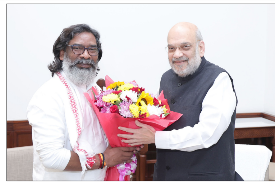
ಕೇಂದ್ರ ಗೃಹ ಸಚಿವ ಅಮಿತ್ ಶಾ ಅವರನ್ನು ಬುಧವಾರ ನವದೆಹಲಿಯಲ್ಲಿ ಜಾರ್ಖಂಡ್ ಮುಖ್ಯಮಂತ್ರಿ ಹೇಮಂತ್ ಸೋಲೇನ್ ಭೇಟಿಯಾಗಿದ್ದರು.

ಜಿಲ್ಲೆಗಳಲ್ಲಿರುವ ಸರ್ಕಾರಿ ಶಿಕ್ಷಣ ಸಂಸ್ಥೆಗಳು, ಉನ್ನತ ಮತ್ತು ತಾಂತ್ರಿಕ ಶಿಕ್ಷಣ ಇಲಾಖೆಯ ಆಡಳಿತದಲ್ಲಿರುವ ಸರ್ಕಾರಿ ಅನುದಾನಿತ ಕಾಲೇಜುಗಳು, ರಾಜ್ಯ ವಿಶ್ವವಿದ್ಯಾಲಯಗಳು ಸೇರಿದಂತೆ ಮುಂದಿನ ಆದೇಶದವರೆಗೆ ಮುಚ್ಚಲಾಗುವುದು ಎಂದು ಪ್ರತಿಜ್ಞೆ ಆದೇಶದಲ್ಲಿ ತಿಳಿಸಲಾಗಿದೆ. ಏತನ್ಮಧ್ಯೆ, ಎಲ್ಲಾ ಐದು ಕಣಿವೆ ಜಿಲ್ಲೆಗಳಲ್ಲಿ ಮತ್ತು ಜಿಬಾ ಮತ್ತು ಕರ್ಪೂರ್ಯ ಅನ್ನು ಬೆಳಿಗ್ಗೆ 5 ರಿಂದ ಮಧ್ಯಾಹ್ನ 12 ವರೆಗೆ ಸಡಿಲಿಸಿ, ಅಗತ್ಯ ವಸ್ತುಗಳು ಮತ್ತು ಔಷಧಿಗಳನ್ನು ಖರೀದಿಸಲು ಅನುವು ಮಾಡಿಕೊಡಲಾಗುತ್ತಿದೆ ಎಂದು ಜಿಲ್ಲಾಧಿಕಾರಿಗಳು ಹೊರಡಿಸಿದ ಆದೇಶದಲ್ಲಿ ತಿಳಿಸಿದ್ದಾರೆ.