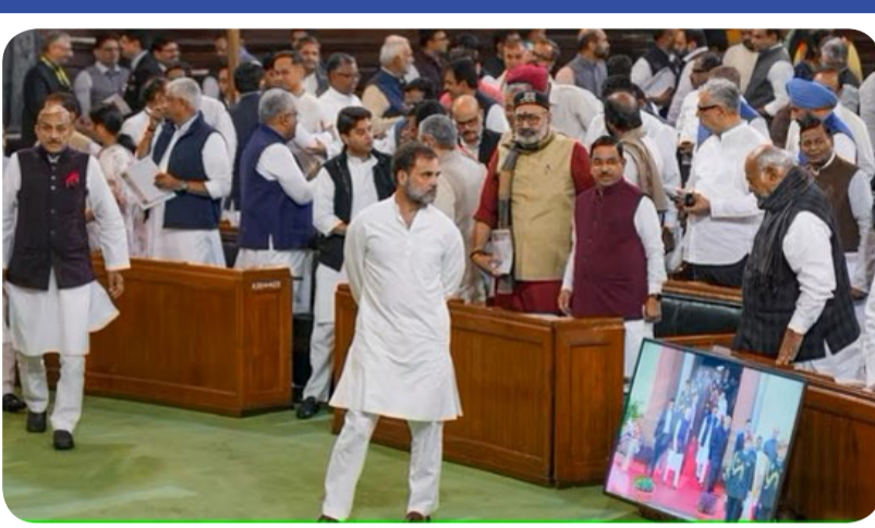
ಪ್ರತಿಭಟಿಸಿದರು. ಈ ಹಿನ್ನೆಲೆ ಸ್ಪೀಕರ್ ಕಲಾಪವನ್ನು ಬಳಿಕ ಪುನರಾರಂಭಗೊಂಡಾಗ ಪ್ರತಿಪಕ್ಷ ಸದಸ್ಯರು ಪ್ರತಿಭಟನೆ ಮುಂದುವರಿಸಿದರು. ಈ ಮಧ್ಯಾಹ್ನ 12 ಗಂಟೆಯವರೆಗೆ ಮುಂದೂಡಿದರು.

ನವದೆಹಲಿ, ನ.27: ಅದಾನಿ ಲಂಚ-ವಂಚನೆ ಪ್ರಕರಣ, ಉತ್ತರ ಪ್ರದೇಶದ ಸಂಭಲ್ ನಲ್ಲಿ ಇತ್ತೀಚೆಗೆ ನಡೆದ ಹಿಂಸಾಚಾರ ಮತ್ತು ಇತರ ವಿಷಯಗಳ ಕುರಿತು ಚರ್ಚೆಗೆ ಆಗ್ರಹಿಸಿ ಪ್ರತಿಪಕ್ಷಗಳ ಸದಸ್ಯರ ಪ್ರತಿಭಟನೆ ಹಿನ್ನೆಲೆ, ಸಂಸತ್ತಿನ ಉಭಯ ಸದನಗಳ ಕಲಾಪಗಳು ಮುಂದೂಡಲಾಗಿದೆ.