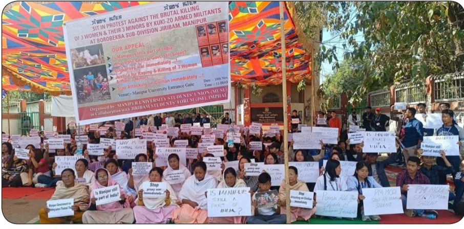
ಜಿಲ್ಲೆಗಳಲ್ಲಿ ನವೆಂಬರ್ 16 ರಿಂದ ಶಾಲೆಗಳು ಮತ್ತು ಕಾಲೇಜುಗಳನ್ನು ಮುಚ್ಚಲಾಗುತ್ತಿವೆ. ಶಿಕ್ಷಣ ಇಲಾಖೆ ಹೊರಡಿಸಿದ ಕೇಂದ್ರೀಯ ಶಾಲೆಗಳ ಎಲ್ಲಾ ಕರ್ಪೂರ್ಯ ವಿಧಿಸಿರುವ

ಜಿಲ್ಲೆಗಳಲ್ಲಿರುವ ಸರ್ಕಾರಿ ಶಿಕ್ಷಣ ಸಂಸ್ಥೆಗಳು, ಉನ್ನತ ಮತ್ತು ತಾಂತ್ರಿಕ ಶಿಕ್ಷಣ ಇಲಾಖೆಯ ಆಡಳಿತದಲ್ಲಿರುವ ಸರ್ಕಾರಿ ಅನುದಾನಿತ ಕಾಲೇಜುಗಳು, ರಾಜ್ಯ ವಿಶ್ವವಿದ್ಯಾಲಯಗಳು ಸೇರಿದಂತೆ ಮುಂದಿನ ಆದೇಶದವರೆಗೆ ಮುಚ್ಚಲಾಗುವುದು ಎಂದು ಪ್ರತಿಜ್ಞೆ ಆದೇಶದಲ್ಲಿ ತಿಳಿಸಲಾಗಿದೆ. ಏತನ್ಮಧ್ಯೆ, ಎಲ್ಲಾ ಐದು ಕಣಿವೆ ಜಿಲ್ಲೆಗಳಲ್ಲಿ ಮತ್ತು ಜಿಬಾ ಮತ್ತು ಕರ್ಪೂರ್ಯ ಅನ್ನು ಬೆಳಿಗ್ಗೆ 5 ರಿಂದ ಮಧ್ಯಾಹ್ನ 12 ವರೆಗೆ ಸಡಿಲಿಸಿ, ಅಗತ್ಯ ವಸ್ತುಗಳು ಮತ್ತು ಔಷಧಿಗಳನ್ನು ಖರೀದಿಸಲು ಅನುವು ಮಾಡಿಕೊಡಲಾಗುತ್ತಿದೆ ಎಂದು ಜಿಲ್ಲಾಧಿಕಾರಿಗಳು ಹೊರಡಿಸಿದ ಆದೇಶದಲ್ಲಿ ತಿಳಿಸಿದ್ದಾರೆ.