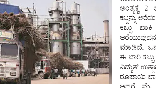
ನಿಗದಿಪಡಿಸಿತ್ತು. ಇದಕ್ಕಾಗಿ ತನ್ನ ವ್ಯಾಪ್ತಿ ಕಬ್ಬು ಬೆಳೆಗಾರರ ಜೊತೆ ಒಪ್ಪಂದ ಕೂಡ ಕಟಾವು ಆಗಿಲ್ಲ. ಈಗಾಗಲೇ ಕಬ್ಬಿನಲ್ಲಿ

ಮಾಡಿಕೊಂಡಿತ್ತು. ಆದರೆ ನವೆಂಬರ್ ಅಂತ್ಯಕ್ಕೆ 2 ಲಕ್ಷದ 01 ಟನ್ ಅನ್ನು ಕಬ್ಬನ್ನು ಅರೆಯಿಸಲಾಗಿದೆ. ಆದರೆ ಇನ್ನಷ್ಟು ಕಬ್ಬು ಬಾಕಿ ಇರುವಾಗಲೇ ಕಬ್ಬು ಅರೆಯುವುದನ್ನು ಪ್ರಸಕ್ತ ವರ್ಷಕ್ಕೆ ಬಂದ್ ಮಾಡಿದೆ. ಒಪ್ಪಂದದಂತೆ ಕಾರ್ಖಾನೆ ಈ ಬಾರಿ ಕಬ್ಬು ಅರೆಯಲಾಗಿದೆ. ಜೊತೆಗೆ ವಿಧ್ಯುಕ್ತ ಉತ್ಪಾದನೆಯಿಂದ ಐದು ಕೋಟಿ ರೂಪಾಯಿ ಲಾಭವನ್ನು ಕೂಡ ಮಾಡಿದೆ. ಆದರೆ ಮೈ ಶುಗರ್ ವ್ಯಾಪ್ತಿಯಲ್ಲಿ ಸಾವಿರಾರು ಹೆಕ್ಟೇರ್ ಪ್ರದೇಶದಲ್ಲಿ ಕಬ್ಬು ಕಟಾವು ಆಗಿಲ್ಲ. ಈಗಾಗಲೇ ಕಬ್ಬಿನಲ್ಲಿ ಸೂಲಿಗೆ ಕೂಡ ಬಂದಿದೆ. ಕಬ್ಬು ತೂಕವನ್ನು ಕಳೆದುಕೊಳ್ಳುತ್ತಿದೆ ಹೀಗಾಗಿ ರೈತರ ಪಾಡು ತೋಚನೀಯವಾಗಿದೆ. ಒಪ್ಪಂದದ ಪ್ರಕಾರ, ಬೇರೆ ಕಾರ್ಖಾನೆಗಳಿಗೂ ಕೂಡ ಕಬ್ಬನ್ನು ಸರಬರಾಜು ಮಾಡದ ಪರಿಸ್ಥಿತಿಯಲ್ಲಿ ರೈತರು ಇದ್ದಾರೆ. ಸರ್ಕಾರವೇ ಇಂತಿಷ್ಟು ವ್ಯಾಪ್ತಿ ಮಾಡಿ, ಇಲ್ಲಿನ ಕಬ್ಬನ್ನು ಖಾಸಗಿ ಕಾರ್ಖಾನೆಗಳು ಪಡೆಯದಂತೆ ಆದೇಶ ಕೂಡ ಮಾಡಿತ್ತು. ಹೀಗಾಗಿ ಕಾರ್ಖಾನೆ ಬಂದ್ ಆಗಿ, ಕಬ್ಬು ಸರಬರಾಜು ಆಗದೇ ಇರುವುದು ಜಿಲ್ಲೆಯ ಕಬ್ಬು ಬೆಳೆಗಾರರನ್ನು ಸಂಕಷ್ಟಕ್ಕೆ ಸಿಲುಕುವಂತೆ ಮಾಡಿದೆ. ಇನ್ನು ಉಳಿದ ಕಬ್ಬನ್ನು ಆಲೆಮನೆಗಳಿಗೆ ಸರಬರಾಜು ಮಾಡೋಣ ಅಂದರೆ ಕಡಿಮೆ ಬೆಲೆಗೆ ಖರೀದಿ ಮಾಡುತ್ತಿದ್ದಾರೆ. ಖಾಸಗಿ ಕಾರ್ಖಾನೆಗಳು ಕೂಡ ತನ್ನ ವ್ಯಾಪ್ತಿಯ ಕಬ್ಬನ್ನು ಬಿಟ್ಟು ಬೇರೆ ಕಬ್ಬನ್ನು ಪಡೆದುಕೊಳ್ಳುತ್ತಿಲ್ಲ. ಹೀಗಾಗಿ ಶಾಲ ಸೋಲಿ ಮಾಡಿ ಕಬ್ಬು ಬೆಳೆದ ರೈತರು ಸಂಕಷ್ಟಕ್ಕೆ ಸಿಲುಕಿದ್ದಾರೆ. ಮೈಶುಗರ್ ಸರ್ಕಾರಿ ಕಾರ್ಖಾನೆ ಪ್ರಸಕ್ತ ವರ್ಷದ ಕಬ್ಬು ಅರೆಯುವಿಕೆಯನ್ನು ಸ್ವೀಕೃತ ಮಾಡಿರುವುದು ಜಿಲ್ಲೆಯ ಕಬ್ಬು ಬೆಳೆಗಾರರನ್ನು ಸಂಕಷ್ಟಕ್ಕೆ ಸಿಲುಕಿದೆ. ಈ ನಿಟ್ಟಿನಲ್ಲಿ ಸರ್ಕಾರ ಸೂಕ್ತ ಕ್ರಮವಹಿಸಬೇಕಿದೆ.