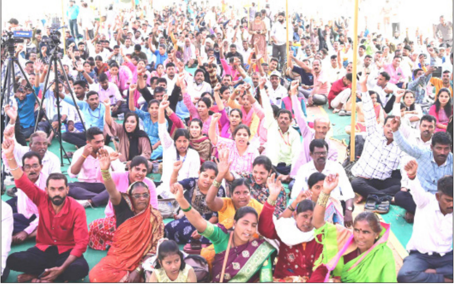
ವೇತನ ಪರಿಷ್ಕರಣೆ ಹಾಗೂ ಬಡ್ಡಿಗೇ ಆಗ್ರಹಿಸಿ ಕರ್ನಾಟಕ ರಾಜ್ಯ ಗ್ರಾಮ ಪಂಚಾಯತಿ ನೌಕರರ ಕ್ಷೇಮಾಭಿವೃದ್ಧಿ ಸಂಘದ ಸದಸ್ಯರು ಬುಧವಾರ ಬೆಂಗಳೂರಿನ ಪ್ರೀಡಂ ಪಾರ್ಕ್‌ನಲ್ಲಿ ಧರಣಿ ನಡೆಸಿದರು.

ಬಂಟಿ ಸದನ ಸಮಿತಿ ಅರ್ಧಯುಕ್ತ ಜಗದಾಂಬಿಕಾ ಪಾಲ್ ಅವರೂ ವಿಜಯಪುರಕ್ಕೆ ಭೇಟಿ ನೀಡಿ ವಿವರಗಳನ್ನು ಪಡೆದರು. ಇವರಲ್ಲ ಬಂದಿರುವಾಗ ನಮ್ಮದು ಪಕ್ಷ ವಿರೋಧಿ ಹೇಗಾಗುತ್ತದೆ? ಎಂದು ಪ್ರಶ್ನಿಸಿದರು. ವಕ್ಫ್ ವಿರುದ್ಧ ರೆಬಲ್ ನಾಯಕರು ಆರಂಭದಿಂದಲೂ ವಿರೋಧ ವ್ಯಕ್ತಪಡಿಸುತ್ತಲೇ ಬಂದಿದ್ದಾರೆ. ಈ ಮಧ್ಯೆ ಇದೀಗ ವಕ್ಫ್ ಬಗ್ಗೆ ಹೆಚ್ಚು-ಹೆಚ್ಚು ದೇಶದಲ್ಲಿ ನೆಹರೂರಿಂದ ಮನಗೋಹರ್ ಸಿಂಗ್ ವರೆಗೂ ವಕ್ಫ್ ಅಧಿಕಾರ ಮತ್ತು ಭೂಮಿ ಕೊಟ್ಟಿದ್ದಾರೆ. ಹೀಗಾಗಿ ದೇಶದಲ್ಲಿ ಒಂಭತ್ತು ವಕ್ಫ್ ವಕ್ಫ್ ಪ್ರಾಪರ್ಟಿ ಈಗಾಗಲೇ ದಾಖಲೆಯಲ್ಲಿದ್ದು, ತಮಿಳುನಾಡಿನಲ್ಲಿ ಸರ್ವಿಯಾರ ವರ್ಷಗಳಿಂದ ಅಸ್ತಿತ್ವದಲ್ಲಿರುವ ಒಂದು ಮೂಲತನ ದೇವಸ್ಥಾನ ಸೇರಿದಂತೆ ಒಂದು ಇಡೀ ಊರು ವಕ್ಫ್ ಎಂದು ಘೋಷಣೆ ಮಾಡಿಕೊಂಡಿದೆ ಎಂದರೆ, ಇವರ ಮನಃಸ್ಥಿತಿ ಹೇಗಿದೆ. ಮುಂದಿನ ಇವರ ಲೆಕ್ಕಾಚಾರ ಎಂಥ ಕರಾಳವಾಗಿದೆ ಎಂಬ ಅರಿವಾಗುತ್ತದೆ ಎಂದರು.