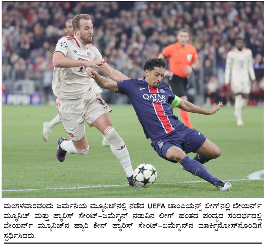
ಮಂಗಳವಾರದಂದು ಜರ್ಮನಿಯ ಮ್ಯೂನಿಚ್‌ನಲ್ಲಿ ನಡೆದ UEFA ಚಾಂಪಿಯನ್ಸ್ ಲೀಗ್‌ನಲ್ಲಿ ಬೇರ್ನಾರ್ಡ್ ಮ್ಯೂನಿಚ್ ಮತ್ತು ಪ್ಯಾರಿಸ್ ಸೇಂಟ್-ಜೆರ್ಮನ್ ನಡುವಿನ ಲೀಗ್ ಹಂತದ ಪಂದ್ಯದ ಸಂದರ್ಭದಲ್ಲಿ ಬೇರ್ನಾರ್ಡ್ ಮ್ಯೂನಿಚ್‌ನ ಹ್ಯಾರಿ ಕೇನ್ ಪ್ಯಾರಿಸ್ ಸೇಂಟ್-ಜೆರ್ಮನ್‌ನ ಮಾರ್ಕೋಸ್‌ನೊಂದಿಗೆ ಸ್ಪರ್ಧಿಸಿದರು.

ತನ್ನ ಆದೇಶದಲ್ಲಿ ತಿಳಿಸಿದೆ. ಕೆಲ ದಿನಗಳ ಹಿಂದೆಯಷ್ಟೇ ವಿನೇಶ್ ಫೋಗಟ್, ಬಜರಂಗ್ ಪುನಿಯಾ ಕಾಂಗ್ರೆಸ್ ಸೇರ್ಪಡೆಯಾದರು. ಆನಂತರ ಪುನಿಯಾ ಅವರನ್ನು ಅಖಿಲ ಭಾರತ ಕಿಸಾನ್ ಕಾಂಗ್ರೆಸ್ ಕಾರ್ಯದರ್ಶಿ ದ್ವೈಕನ್ಶಿನ್ ನನ್ನಿಗಿ ನೇಮಿಸಲಾಯಿತು. ಇದಕ್ಕೂ ಮುನ್ನ ಅವರು ರೈಲ್ವೆ ಉದ್ಯೋಗಕ್ಕೆ ರಾಜೀನಾಮೆ ನೀಡಿದ್ದರು.