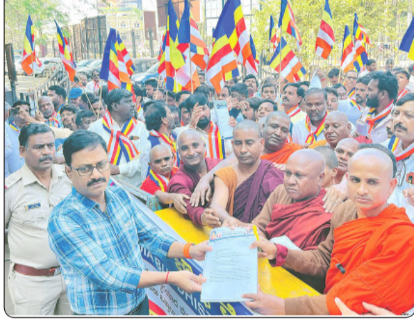
ಬೀದರ್‌ನಲ್ಲಿ ಆಲ್ ಇಂಡಿಯಾ ಬುದ್ಧಿಷ್ಠ ಪೋರಮ್ ವತಿಯಿಂದ ಬೌದ್ಧರ ಧಾರ್ಮಿಕ ಹಕ್ಕಿಗಾಗಿ ಬೃಹತ್ ಪ್ರತಿಭಟನೆ ರಾಜ್ಯದ ಮುಖಂಡರು ಬಳಿಕ ಮನವಿ ಸಲ್ಲಿಸಲಾಯಿತು.