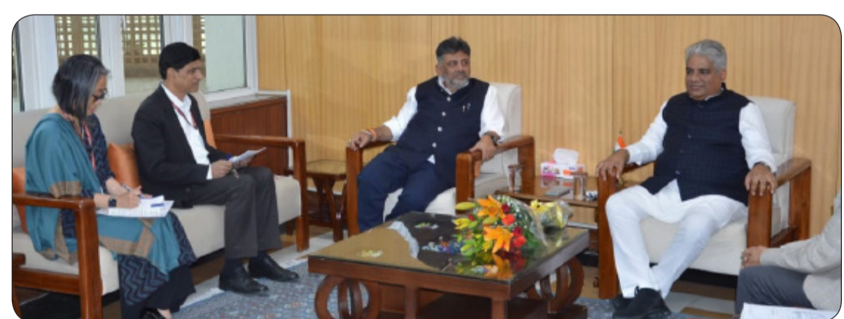
ನವದೆಹಲಿಯಲ್ಲಿ ಕರ್ನಾಟಕದ ಉಪಮುಖ್ಯಮಂತ್ರಿ ಡಿ.ಕೆ.ಶಿವಕುಮಾರ್ ಅವರು ಕೇಂದ್ರ ಅರಣ್ಯ ಸಚಿವ ಭೂಪೇಂದ್ರ ಯಾದವ್ ಅವರನ್ನು ಭೇಟಿ ಮಾಡಿದರು.

ನವದೆಹಲಿ, ನ.27: ಕಳಸಾ ಬಂಡಾರಿ ನಾಲೆ ಯೋಜನೆ ವಿಚಾರದಲ್ಲಿ ಕೇಂದ್ರ ಸಚಿವರು ಮಧ್ಯಪ್ರದೇಶ ಮಾಡಿ ಅಗತ್ಯವಿರುವ ಅರಣ್ಯ ಹಾಗೂ ವನ್ಯಜೀವಿ ಮಂಡಳಿ ಅನುಮತಿ ಕೊಡಿಸಬೇಕು ಎಂದು ಡಿಸಿಎಂ ಡಿ.ಕೆ.ಶಿವಕುಮಾರ್ ಅವರು ಕೇಂದ್ರ ಅರಣ್ಯ ಸಚಿವ ಭೂಪೇಂದ್ರ ಯಾದವ್ ಅವರಿಗೆ ಮನವಿ ಮಾಡಿದ್ದಾರೆ.