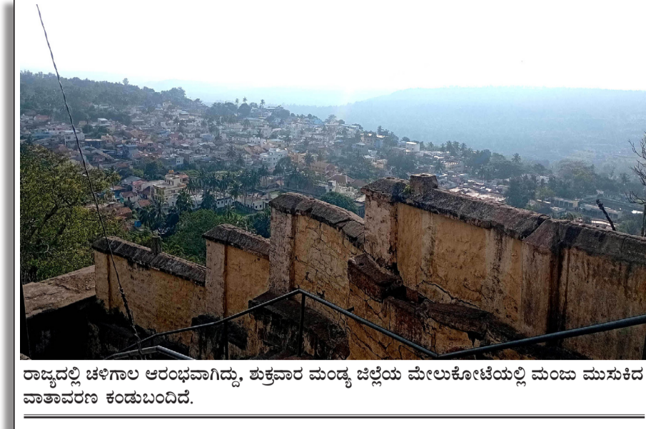
ರಾಜ್ಯದಲ್ಲಿ ಚಳಿಗಾಲ ಆರಂಭವಾಗಿದ್ದು, ಶುಕ್ರವಾರ ಮಂಡ್ಯ ಜಿಲ್ಲೆಯ ಮೇಲಕೋಟೆಯಲ್ಲಿ ಮಂಜು ಮುಸುಕಿದ ವಾತಾವರಣ ಕಂಡುಬಂದಿದೆ.