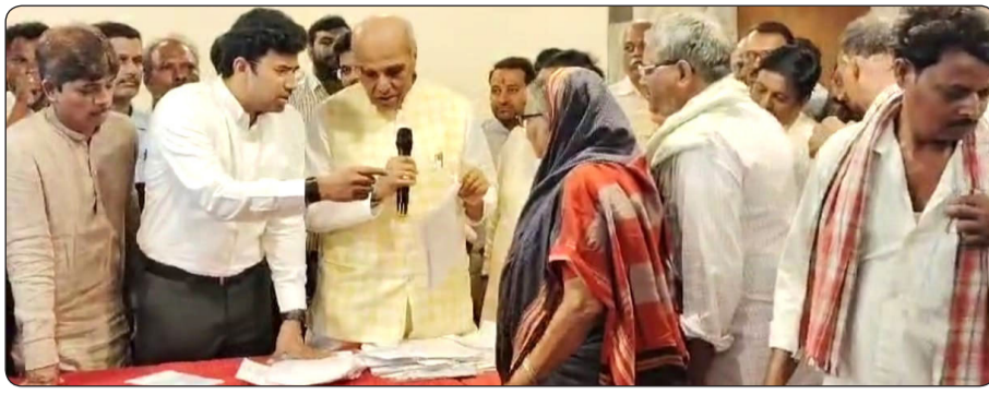
ಹುಬ್ಬಳ್ಳಿ ನಗರದ ಖಾಸಗಿ ಹೊಟೆಲ್‌ನಲ್ಲಿ ಜಂಟಿ ಸದನ ಸಮಿತಿ ಅಧ್ಯಕ್ಷ ಜಗದಾಂಬಿಕಾ ಪಾಲ್ ಅವರಿಗೆ ವಕ್ಫ್ ಮಂಡಳಿ ವಿರುದ್ಧ ರೈತರು ಹಾಗೂ ದೇವಸ್ಥಾನಗಳವರು ತಮ್ಮ ದೂರುಗಳನ್ನು ಸಲ್ಲಿಸಿದರು