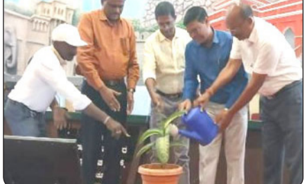
ಜಿಲ್ಲೆಯಲ್ಲಿ ನ.06ರಂದು 20ವರೆಗೆ ಜಲ ಜೀವನ ಮಿಷನ್ ಯೋಜನೆಯಡಿ ಹಮ್ಮಿಕೊಳ್ಳಲಾಗಿದ್ದ ಜಿಲ್ಲಾತ್ಮಕ ಆಂದೋಲನಕ್ಕೆ ಚಾಲನೆ ನೀಡಿ, ಮಾತನಾಡಿದರು.