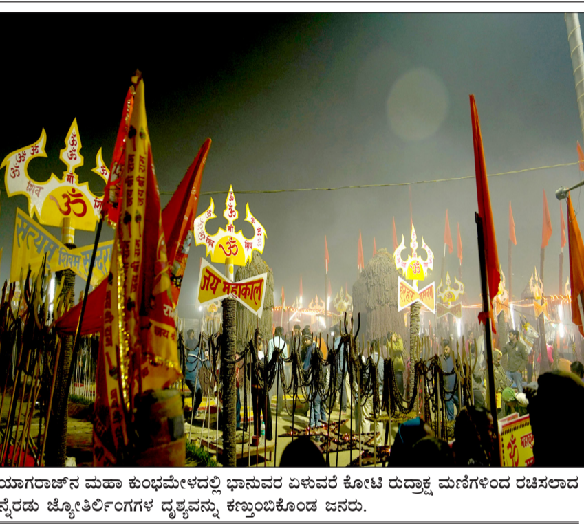
ಪ್ರಯಾಗರಾಜ್‌ನ ಮಹಾ ಕುಂಭಮೇಳದಲ್ಲಿ ಭಾನುವರ ಏಳುವರೆ ಕೋಟಿ ರುದ್ರಾಕ್ಷ ಮಣಿಗಳಿಂದ ರಚಿಸಲಾದ ಹನ್ನೆರಡು ಜ್ಯೋತಿರ್ಲಿಂಗಗಳ ದೃಶ್ಯವನ್ನು ಕಣ್ಮರಿಸಿಕೊಂಡ ಜನರು.

ವಿಚ್ಛೇದನ ಅಥವಾ ಕೌಟುಂಬಿಕ ವಿವಾದದ ಸಂದರ್ಭದಲ್ಲಿ, ಐದು ವರ್ಷದವರೆಗೆ ನಡವುವ ಸಾಲಿನ ತಾಯಿಯ ಬಳಿ ಇರುತ್ತದೆ. * ಆಸ್ತಿಯಲ್ಲಿ ಮಗ ಮತ್ತು ಮಗಳಿಗೆ ಸಮಾನ ಹಕ್ಕು ಇರುತ್ತದೆ * ಅಕ್ಕಮ ಹಕ್ಕುಗಳನ್ನು ಸಹ ಆ ದಂಪತಿಗಳ ಜೈವಿಕ ಮಕ್ಕಳು ಎಂದು ಪರಿಗಣಿಸಲಾಗುತ್ತದೆ. ಬಾಡಿಗೆ ತಾಯಿಯ ನೆರವಿನ ಸಂತಾನೋತ್ಪತ್ತಿ ತಂತ್ರಜ್ಞಾನದ ಮೂಲಕ ಜನಿಸಿದ ದತ್ತು ಮಕ್ಕಳು ಜೈವಿಕ ಮಕ್ಕಳಾಗಿರುತ್ತಾರೆ. * ಮಹಿಳೆಯು ಗರ್ಭದಲ್ಲಿರುವ ಮಗುವಿನ ಆಸ್ತಿ ಹಕ್ಕುಗಳನ್ನು ರಕ್ಷಿಸಲಾಗುವುದು. ಒಬ್ಬ ವ್ಯಕ್ತಿಯು ತನ್ನ ಆಸ್ತಿಯನ್ನು ಇಚ್ಛೆಯ ಮೂಲಕ ಯಾವುದೇ ವ್ಯಕ್ತಿಗೆ ನೀಡಬಹುದು * ಲೀವ್-ಇನ್ ಹೌಸ್‌ನಲ್ಲಿ ವಾಸಿಸುವ ಪ್ರತಿಯೊಬ್ಬ ವ್ಯಕ್ತಿಗೆ ವೆಬ್ ಫೋರ್ಟ್‌ನಲ್ಲಿ ನೋಂದಣಿ ಕಡ್ಡಾಯವಾಗಿರುತ್ತದೆ. * ನೋಂದಣಿ ರಶೀದಿಯ ಮೂಲಕ ಮಾತ್ರ ದಂಪತಿಗಳು ಬಾಡಿಗೆಗೆ ಮನೆ, ಹಾಸ್ಟೆಲ್ ಅಥವಾ ಪಿಜಿ ತೆಗೆದುಕೊಳ್ಳಲು ಅವಕಾಶ * ಲೀವ್-ಇನ್ ಜನಿಸಿದ ಮಕ್ಕಳನ್ನು ಕಾನೂನುಬದ್ಧ ಮಕ್ಕಳು ಎಂದು ಪರಿಗಣಿಸಲಾಗುತ್ತದೆ ಮತ್ತು ಜೈವಿಕ ಮಕ್ಕಳ ಎಲ್ಲಾ ಹಕ್ಕುಗಳನ್ನು ಪಡೆಯುತ್ತಾರೆ. ಲೀವ್-ಇನ್ ಸಂಬಂಧ ಕಡ್ಡಾಯವಾಗಿ ನೋಂದಣಿ ಮಾಡದಿದ್ದರೆ ಆರು ತಿಂಗಳ ಜೈಲು ಶಿಕ್ಷೆ ಅಥವಾ 25,000 ರೂಪಾಯಿ ದಂಡ ಅಥವಾ ಎರಡನ್ನೂ ವಿಧಿಸಲು ಅವಕಾಶವಿದೆ.