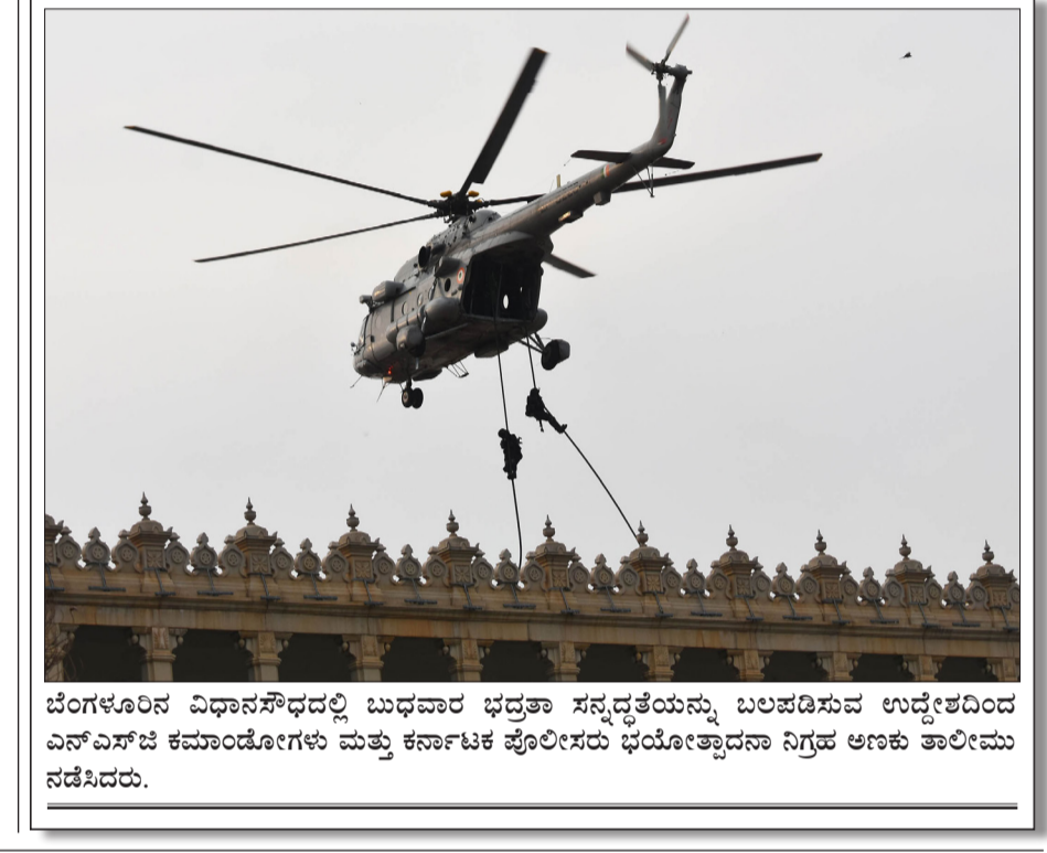
ಬೆಂಗಳೂರಿನ ವಿಧಾನಸೌಧದಲ್ಲಿ ಬುಧವಾರ ಭದ್ರತಾ ಸನ್ನದ್ಧತೆಯನ್ನು ಬಲಪಡಿಸುವ ಉದ್ದೇಶದಿಂದ ಎನ್‌ಎಸ್‌ಜಿ ಕಮಾಂಡೋಗಳು ಮತ್ತು ಕರ್ನಾಟಕ ಪೋಲೀಸರು ಭಯೋತ್ಪಾದನಾ ನಿಗ್ರಹ ಅಣಕು ತಾಲೀಮು ನಡೆಸಿದರು.

ಸ್ಫೋಟಕ ವಿನಾಶದ ತಂದಿದ್ದನೇ ಎಂಬ ಬಗ್ಗೆಯೂ ಪೋಲೀಸರು ಮಾಹಿತಿಗಳನ್ನು ಕಲೆಹಾಕುತ್ತಿದ್ದಾರೆ. ತಮಿಳುನಾಡಿನಲ್ಲಿ ಜಲಿಲನ್ ಕಡ್ಡಿ ತಯಾರಿಕೆಯ ಕಾರ್ಖಾನೆಗಳು ಹೆಚ್ಚು ಇವೆ. ತನಿಖಾ ತಂಡ ಅಲ್ಲಿನ ಕಾರ್ಖಾನೆಗಳಿಗೂ ಭೇಟಿ ನೀಡಿ, ಜಲಿಲನ್ ಕಡ್ಡಿ ತಯಾರಿಸುವವರು ಹಾಗೂ ಮಾರಾಟಗಾರರ ಬಗ್ಗೆ ಮಾಹಿತಿ ಪಡೆದುಕೊಳ್ಳುತ್ತಿದೆ. ಹೊರವಲಯದಲ್ಲಿ ಸಿಕ್ಕಿರುವ ಜಲಿಲನ್ ಕಡ್ಡಿಗಳು ಸುಮಾರು 2 ವರ್ಷಕ್ಕಿಂತ ಹೆಚ್ಚಿನವು. ಒಂದು ವೇಳೆ ಅದನ್ನು ಸ್ಫೋಟಿಸಿದರೂ ಹೆಚ್ಚು ಹಾನಿ ಉಂಟು ಮಾಡುವ ಸಾಮರ್ಥ್ಯ ಕಳೆದುಕೊಂಡಿರುತ್ತವೆ ಎಂಬುವುದು ಗೊತ್ತಾಗಿದೆ. ಒಂದು ವೇಳೆ ಕ್ಷಾರಗಳಲ್ಲಿ ಕೆಲಸ ಮಾಡುವವರು ಏನಾದರೂ ಬಳಕೆಗೆ ಬರುವುದಿಲ್ಲವೆಂದು ಈ ಇಟ್ಟುಕೊಂಡಿರುವವರು ಬಗ್ಗೆಯೂ ಸಹ ಪೋಲೀಸರು ತನಿಖೆ ನಡೆಸುತ್ತಿದ್ದಾರೆ. ಒಟ್ಟಾರೆ ಜಲಿಲನ್ ಕಡ್ಡಿ ಪ್ರಧಾನಿ ನರೇಂದ್ರ ಮೋದಿ ಅವರು ನಗರಕ್ಕೆ ಬಂದ ದಿನವೇ ಪತ್ತೆಯಾಗಿರುವುದರಿಂದ ಈ ಪ್ರಕರಣವನ್ನು ಗಂಭೀರವಾಗಿ ಪರಿಗಣಿಸಿ ಪೋಲೀಸರು ವಿವಿಧ ದೃಷ್ಟಿಕೋನಗಳಲ್ಲಿ ತನಿಖೆ ನಡೆಸುತ್ತಿದ್ದಾರೆ.