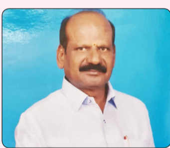
ಪ್ರಧಾನ ಮಂತ್ರಿ ಮೋದಿ ಅವರು ತೆಗೆದುಕೊಂಡ ಅಭಿವೃದ್ಧಿಗಾಗಿ ಇರಲಿವೆ, ದೇಶದ ಜನರ