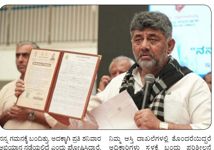
ನನ್ನ ಇ-ಖಾತಾ, ನನ್ನ ಹಕ್ಕು ಅಭಿಯಾನಕ್ಕೆ ಡಿಸಿಎಂ ಡಿ.ಕೆ. ಶಿವಕುಮಾರ್ ಚಾಲನೆ

ಯಾರಾದರೂ ನಕಲಿ ದಾಖಲೆಗಳನ್ನು ನೀಡಿ ಖಾತೆ ಮಾಡಿಕೊಂಡರೆ ಅದನ್ನು ರದ್ದು ಮಾಡುವ ವ್ಯವಸ್ಥೆಯೂ ಇದೆ. ನಿಗದಿತ ನಂಬರ್ ನೀಡಿದ ತಕ್ಷಣ 2004 ರ ನಂತರದ ಎಲ್ಲಾ ದಾಖಲೆಗಳು ದೊರೆಯುತ್ತವೆ. ಸಬ್ ರಿಜಿಸ್ಟ್ರಾರ್ ಕಚೇರಿಗೆ ಲಿಂಕ್ ಮಾಡಲಾಗಿದೆ. ಅರ್ಹ ಮಾಲೀಕರಿಗೆ ಖಾತೆ ಮಾಡಿಕೊಡಲಾಗುವುದು ಎಂದು ತಿಳಿಸಿದ್ದಾರೆ.ನಿಮ್ಮ ಆಸ್ತಿ ಮೌಲ್ಯಗಳನ್ನು ಹೆಚ್ಚಳ ಮಾಡಲು ಬಿಡುಗಡೆಯಿಂದ ಖಾತೆಗೆ ಪರಿವರ್ತನೆ ಮಾಡಿಕೊಡಲಾಗುತ್ತಿದೆ. ಇದು ಬಹಿಷ್ಕಾರ ತೀರ್ಮಾನ. ಇದರಿಂದ ನೀವು ಬ್ಯಾಂಕ್ ನಲ್ಲಿ ಸಾಲ ಪಡೆಯಬಹುದು ಹಾಗೂ ಇತರೇ ಸೌಲಭ್ಯಗಳನ್ನು ನಿಮ್ಮದಾಗಿಸಿಕೊಳ್ಳಬಹುದು. ಬೆಂಗಳೂರಿನಲ್ಲಿರುವ 23 ಲಕ್ಷ ಆಸ್ತಿಗಳಲ್ಲಿ 16 ಲಕ್ಷ ಖಾತೆಗಳಿದ್ದರೆ 7 ಲಕ್ಷ ಖಾತೆಗಳಿವೆ. ಕೆಳ ಮಟ್ಟದ ಅಧಿಕಾರಿಗಳು ಖಾತೆ ವಿಚಾರವಾಗಿ ಲಂಚ ಪಡೆದು ಕುರುಹು ನೀಡುತ್ತಿದ್ದರು ಎನ್ನುವುದು