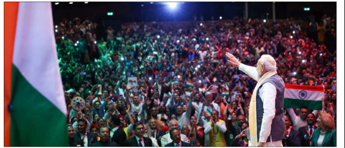
ನೇದರ್ ಲ್ಯಾಂಡ್‌ನ ಹೇಗ್ ನಗರದಲ್ಲಿ ಭಾರತೀಯ ಸಮುದಾಯದ ವತಿಯಿಂದ ಶನಿವಾರ ಆಯೋಜಿಸಿದ್ದ ಕಾರ್ಯಕ್ರಮದಲ್ಲಿ ಅಭಿಮಾನಿಗಳ ತ್ಯಕ್ತ ಕೈಬೀಸಿದ ಪ್ರಧಾನ ಮಂತ್ರಿ ನೆರೇಂದ್ರ ಮೋದಿ.

ಕಾಂಗ್ರೆಸ್ ಅಧ್ಯಕ್ಷ ಮಲ್ಲಿಕಾರ್ಜುನ ಖರ್ಗೆ ಕೂಡ ಸರ್ಕಾರದ ಮೇಲೆ ತೀವ್ರ ವಾಗ್ದಾಳಿ ನಡೆಸಿದರು. ಹೆಚ್ಚು ಪ್ರಕಾರ ಪಡೆದ 'ಅಮೃತ ಕಾಲ' ನೇಮಕಾತಿ ಮತ್ತು ಪ್ರವೇಶ ಪರೀಕ್ಷೆಗಳಲ್ಲಿ ಬರೆಯುವ ವಿದ್ಯಾರ್ಥಿಗಳಿಗೆ 'ಮೃತ ಕಾಲ'ವಾಗಿ ಮಾರ್ಪಟ್ಟಿದೆ ಎಂದು ಹೇಳಿದರು. 'ಮೋದಿ ಸರ್ಕಾರದ ಅಡಿಯಲ್ಲಿ, 'ಅಮೃತ ಕಾಲ' ಎಂದು ಕರೆಯಲ್ಪಡುವ ಪರೀಕ್ಷೆ ನೇಮಕಾತಿ ಮತ್ತು ಪ್ರವೇಶ ಪರೀಕ್ಷೆಗಳಲ್ಲಿ ಬರೆಯುವ ವಿದ್ಯಾರ್ಥಿಗಳಿಗೆ 'ಮೃತ ಕಾಲ'ವಾಗಿ ಬದಲಾಗುತ್ತಿದೆ' ಎಂದು ಖರ್ಗೆ ಹೇಳಿಕೆಯಲ್ಲಿ ಕಿಡಿ ಕಾರಿದ್ದಾರೆ.