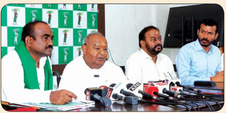
ಬಡವಿ ಟೆಂಟ್‌ನಲ್ಲಿ ಏಳಿ ಕಿತ್ತಿ ಕಿತ್ತಿ ಗುಡುಗು. ಅಂದು ವಿರೋಧ ವ್ಯಕ್ತವಾಗಿದ್ದು ಟೆಂಟ್‌ನಲ್ಲಿ ಯೋಜನೆಗಳನ್ನು ಎಚ್‌ಡಿ.ಕೆ. ಶಿವಕುಮಾರ್ ಈಗಲೂ ಕೂಡ ಬಡವಿ ಟೆಂಟ್‌ನಲ್ಲಿ ಯೋಜನೆಗೆ ಜನರ ಆಕ್ರೋಶ, ವಿರೋಧ ಇದೆ. ಹೀಗಾಗಿ ಯೋಜನೆಯನ್ನು ತಕ್ಷಣವೇ ಕೈಬಿಡಬೇಕು ಎಂದು ದೇವೇಗೌಡ ಆಗ್ರಹಿಸಿದರು. ಅಲ್ಲದೆ ಕಾಂಗ್ರೆಸ್ ಪಕ್ಷದ ನಾಯಕರು ದೂಡ್ಡ

ಬೆಂಗಳೂರು, ಮೇ 16: ಬಡವಿ ಟೆಂಟ್‌ನಲ್ಲಿ ರೈತರ ಜಮೀನು ಕಿತ್ತುಕೊಂಡು ದಂಧೆ ನಡೆಸಲು ಹೊರಟಿದ್ದಾರೆ ಎಂದು ಆಕ್ರೋಶ ವ್ಯಕ್ತಪಡಿಸಿರುವ ಮಾಜಿ ಪ್ರಧಾನಿ ಎಚ್.ಡಿ. ದೇವೇಗೌಡರು, ಈ ದಂಧೆಯ ವಿರುದ್ಧ ಹೋರಾಟಕ್ಕೆ ಧುಮುಕುವುದಾಗಿ ಘೋಷಿಸಿದರು. ಜೆಡಿಎಸ್ ಪಕ್ಷದ ರಾಜ್ಯ ಕಚೇರಿ ಜೆಪಿ ಭವನದಲ್ಲಿ ಮುಖ್ಯಮಂತ್ರಿ ಮುಖ್ಯಮಂತ್ರಿಗಳೊಟ್ಟಿಗೆ ಉದ್ದೇಶಿಸಿ ಮಾಜಿ ಪ್ರಧಾನಿಗಳು ಮಾತನಾಡಿ, ರೈತರ ಭೂಮಿಯನ್ನು ಕಿತ್ತುಕೊಂಡು ದಂಧೆ ಮಾಡಲು ಈ ಸರ್ಕಾರ ಹೊರಟಿದೆ. ಒಬ್ಬರು ರೈತರು ಹೊಡೆದರೆ ಹೊಡೆಸಿಕೊಳ್ಳುವೆ ಎಂದಿದ್ದಾರೆ. ಮೊದಲು ರೈತರಿಂದ ಹೊಡೆಸಿಕೊಂಡು ಬರಲಿ, ಆಮೇಲೆ ನಾನು ಹೋಗಿ ಮಾತನಾಡುತ್ತೇನೆ ಎಂದು ಗುಡುಗಿದರು. ಬೆಂಗಳೂರು ನಗರದ ಮೇಲೆ ಹೆಚ್ಚು ಒತ್ತಡ ಆಗುತ್ತದೆ ಎಂದು ಕುಮಾರಸ್ವಾಮಿ