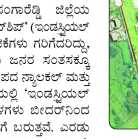
ಈಗಾಗಲೇ ಅಲ್ಲಿ ಕೆಲಸ ನಿರ್ವಹಿಸುತ್ತಿದ್ದಾರೆ. ಈಗ ಇಂಡಸ್ಟ್ರಿಯಲ್ ಟೌನ್‌ಶಿಪ್‌ನಿಂದ ಮತ್ತಷ್ಟು ಮಂದಿಗೆ ನೌಕರಿಗಳು ಲಭಿಸಲಿವೆ. ಯೋಜನೆಗೆ ಒಟ್ಟು 12,635 ಎಕರೆ ಜಮೀನು ಬೇಕು. ಆದರೆ, 2029ರ ವೇಳೆಗೆ 9 ಸಾವಿರ ಎಕರೆ ಪ್ರದೇಶದಲ್ಲಿ ಮೊದಲ ಹಂತದ ಯೋಜನೆ ಅನುಷ್ಠಾನಗೊಳಿಸಲು ನಿರ್ಧರಿಸಲಾಗಿದೆ. ತೆಲಂಗಾಣ ಮುಖ್ಯಮಂತ್ರಿ ರೇವಂತ ರೆಡ್ಡಿ ಅವರು ವಿಶೇಷ ಆಸ್ಪತ್ರೆ ವಹಿಸಿ, ಯೋಜನೆಯ ಮೇಲೆ ವಿಶೇಷ ನಿಗಾ ವಹಿಸಿದ್ದಾರೆ. ಹೀಗಾಗಿ ಯುಜಿಸ್ ಅಂದುಕೊಂಡಂತೆ ನಡೆದರೆ ಬೀದರ್ ಜಿಲ್ಲೆಯ ಎಲ್ಲವುಗಳೂ ಮುಟ್ಟಿಗೆ ದೊಡ್ಡ ವಿಷಯವೇ ಸರಿ. ಕೇಂದ್ರ ಸರ್ಕಾರವು ದೇಶದ ಹತ್ತು ರಾಜ್ಯಗಳ 12 ಕಡೆಗಳಲ್ಲಿ ಈ ಯೋಜನೆ ಹಾಕಿಕೊಂಡಿದೆ. ಈ ಯೋಜನೆಯ ಅನುಷ್ಠಾನಕ್ಕಾಗಿ ಒಟ್ಟು 28 ಸಾವಿರ ಕೋಟಿ ತೆಗೆದಿರಲಿದೆ. ಆಯಾ ರಾಜ್ಯಗಳ ಕೈಗಾರಿಕೆಗಳ ನಿಗಮದ ಸಹಯೋಗದಲ್ಲಿ ಯೋಜನೆ ಅನುಷ್ಠಾನಗೊಳಿಸಲಾಗುತ್ತದೆ. ತೆಲಂಗಾಣದ ಜಿಲ್ಲಾಧಿಕಾರಿ ಕೂಡ ಈ ಯೋಜನೆಯಡಿ ಸೇರಿದೆ. ಕರ್ನಾಟಕ ರಾಜ್ಯವೂ ಇದಕ್ಕೆ ಸೇರ್ಪಡೆಯಾಗಲಿ. ಇಂಡಸ್ಟ್ರಿಯಲ್ ಟೌನ್‌ಶಿಪ್ ಹೇಗಿರಲಿದೆ: ಮುಂಬೈ-ಹೈದರಾಬಾದ್ ರಾಷ್ಟ್ರೀಯ ಹೆದ್ದಾರಿಯಲ್ಲಿರುವ ಜಿಲ್ಲಾಧಿಕಾರಿ ಸಮೀಪದ ಸ್ಥಳ ಮತ್ತು ಝರಾಸಂಗಮ ಮಂಡಲ್ ವ್ಯಾಪ್ತಿಯಲ್ಲಿ ಸ್ಥಳೀಯ 2.77 ಲಕ್ಷಕ್ಕೂ ಅಧಿಕ ಉದ್ಯೋಗ ಸೃಷ್ಟಿಸುವ ಗುರಿ, ಉತ್ಪಾದನಾ ವಲಯದ ಬಲವರ್ಧನೆ. ಆಟೋಮೊಬೈಲ್, ಎಲೆಕ್ಟ್ರಾನಿಕ್ಸ್ ಮತ್ತು ಫಾರ್ಮಸುಟಿಕಲ್ಸ್ ಕ್ಷೇತ್ರದಲ್ಲಿ ಹೆಚ್ಚಿನ ಹೂಡಿಕೆ ಒಟ್ಟು 12,635 ಎಕರೆ ಜಮೀನಿನಲ್ಲಿ ಇಂಡಸ್ಟ್ರಿಯಲ್ ಟೌನ್‌ಶಿಪ್. ಮೊದಲ ಹಂತದಲ್ಲಿ 9 ಸಾವಿರ ಎಕರೆ ಜಮೀನು

ಬೀದರ್, ಮೇ. 16: ಜಿಲ್ಲೆಯ ತೆಲಂಗಾಣ ಗಡಿ ಹೊಂದಿಕೊಂಡಿರುವ ನೆರೆಯ ಸಂಗಾರ್ಡಿ ಜಿಲ್ಲೆಯ ಜಿಲ್ಲಾಧಿಕಾರಿಗಳಿಂದ "ಇಂಡಸ್ಟ್ರಿಯಲ್ ಟೌನ್‌ಶಿಪ್" (ಇಂಡಸ್ಟ್ರಿಯಲ್ ಸ್ಪಾಟ್ ಸಿಟಿ) ನಿರ್ಮಾಣ ಚಟುವಟಿಕೆಗಳು ಗರಿಗರಿಯಲ್ಲಿ ಸಹಜವಾಗಿಯೇ ಬೀದರ್ ಜಿಲ್ಲೆಯ ಜನರ ಸಂತಸಕ್ಕೂ ಕಾರಣವಾಗಿದೆ. ಇದೇ ಜಿಲ್ಲೆಯ ಜನರ ಸಂತಸಕ್ಕೆ ಮತ್ತು ಝರಾಸಂಗಮ ಮಂಡಲ್ ವ್ಯಾಪ್ತಿಯಲ್ಲಿ "ಇಂಡಸ್ಟ್ರಿಯಲ್ ಟೌನ್‌ಶಿಪ್" ತಲೆ ಎತ್ತಲಿದೆ. ಈ ಸ್ಥಳಗಳು ಬೀದರ್‌ನಿಂದ 30 ರಿಂದ 40 ಕಿ.ಮೀ ವ್ಯಾಪ್ತಿಯಲ್ಲಿ ಬರುತ್ತವೆ. ಎರಡು ಕಡೆಯವರ ನಡುವೆ ಆರಂಭದಿಂದಲೂ ಉತ್ತಮ ತೀರ ವಿವರ. ಎರಡೂ ಕಡೆಯವರ ನಡುವೆ ಕೂಡು ಕೊಳ್ಳುವಿಕೆಗಳ ಸೌಹಾರ್ದತೆ ಇರುವುದರಿಂದ ಉತ್ತಮ ಬಾಂಧವ್ಯವಿದೆ. ಬೃಹತ್ ಕೈಗಾರಿಕಾ ಟೌನ್‌ಶಿಪ್ ನಿರ್ಮಾಣದಿಂದ 2.77 ಕ್ಕೂ ಅಧಿಕವೂ ಅಧಿಕ ಹುದ್ದೆ ಸೃಷ್ಟಿಯಾಗುವ ಸಾಧ್ಯತೆ ಇದೆ. ಆಟೋಮೊಬೈಲ್, ಎಲೆಕ್ಟ್ರಾನಿಕ್ಸ್, ಆಹಾರ ಸಂಸ್ಕರಣೆ ಸೇರಿದಂತೆ ವಿವಿಧ ಪ್ರಕಾರದ ಉದ್ಯಮಗಳು ಬರಲಿವೆ. ತೆಲಂಗಾಣ ರಾಜ್ಯ ಕೈಗಾರಿಕಾ ಮೂಲಸೌಕರ್ಯ ನಿಗಮವು ಕೈಗಾರಿಕಾ ಕ್ಷೇತ್ರದಲ್ಲಿ ಹೆಚ್ಚಿನ ಪ್ರಗತಿ ಸಾಧಿಸುವ ಉದ್ದೇಶದಿಂದ ಈ ಮಹತ್ವದ ಯೋಜನೆಯನ್ನು ಜಿಲ್ಲಾಧಿಕಾರಿಗಳಿಗೆ ವಿಸ್ತರಿಸುತ್ತಿದೆ. ಇತ್ತೀಚೆಗೆ ಪ್ರಧಾನಿ ನರೇಂದ್ರ ಮೊದಿಯವರು ಈ ಯೋಜನೆಗೆ ಚಾಲನೆ ಕೊಟ್ಟಿದ್ದಾರೆ. ಇದೊಂದು ರಾಷ್ಟ್ರಮಟ್ಟದ ದೊಡ್ಡ ಯೋಜನೆ ಆಗಿರುವುದರಿಂದ ಸಹಜವಾಗಿಯೇ ಎಲ್ಲರಿಗೂ ಉದ್ಯೋಗಾವಕಾಶಗಳು ಲಭಿಸಲಿವೆ. ಆದರೆ, ಬೀದರ್ ಸಮೀಪದಲ್ಲೇ ಇರುವುದರಿಂದ ಇಲ್ಲಿನ ಯುವಕ/ಯುವತಿಯರಿಗೆ ಹೆಚ್ಚಿನ ಅವಕಾಶಗಳು ದೊರೆಯಲಿವೆ. ಅದರಲ್ಲೂ ಎಂಜಿನಿಯರಿಂಗ್, ಡಿಪ್ಲೋಮಾ, ಐಟಿಐ ಸೇರಿದಂತೆ ಇತರ ತಾಂತ್ರಿಕ ಪದವಿ ಕೋರ್ಸ್‌ಗಳನ್ನು ಮಾಡಿದವರಿಗೆ ಸಹಜವಾಗಿಯೇ ಬೇಡಿಕೆ ಬರಲಿದೆ. ತಮ್ಮ ಪಕ್ಕದ ಊರಿನಲ್ಲಿಯೇ ಉದ್ಯೋಗಾವಕಾಶಗಳು ಸಿಕ್ಕರೆ ದೂರದ ಬೆಂಗಳೂರು, ಮುಂಬೈ, ಪುಣೆಗೆ ವಲಸೆ ಹೋಗುವುದು ಇದರಿಂದ ತಪ್ಪಲಿದೆ. ರಾಜಧಾನಿ ಬೆಂಗಳೂರಿನ ನಂತರ ಐಟಿ ಕ್ಷೇತ್ರದಲ್ಲಿ ಹೈದರಾಬಾದ್ ಗಣನೀಯವಾಗಿ ಬೆಳೆದಿರುವುದರಿಂದ ಜಿಲ್ಲೆಯ ಅನೇಕ ಯುವಕ/ಯುವತಿಯರು