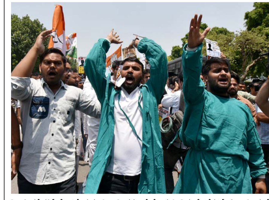
ನಿರೀಕ್ಷೆ ಪ್ರತಿಭಟನೆ ಸೋರಿಕೆ ಮತ್ತು ವಿದ್ಯಾರ್ಥಿಗಳ ಬಗ್ಗೆ ಕೇಂದ್ರ ನೀಡಿದ ಹೇಳಿಕೆಗಳಿಗೆ ಸಂಬಂಧಿಸಿದಂತೆ ತಿಕ್ಕೇಣ ಸಚಿವ ಭವೇಂದ್ರ ಪ್ರಧಾನ್ ವಿರುದ್ಧ ಯುವ ಕಾಂಗ್ರೆಸ್ ಕಾರ್ಯಕರ್ತರು ಶನಿವಾರ ನವದೆಹಲಿಯ ತೀರ್ನ ಮೂರ್ತಿ ಭವನದ ರಸ್ತೆಯಲ್ಲಿ ಪ್ರತಿಭಟನೆ ನಡೆಸಿದರು.

ವರಿಷ್ಠ ವ್ಯಾಂಕ್‌ನ ಈ ಕ್ರಮದಿಂದಾಗಿ ಸದ್ಯ ರೂಪಾಯಿ ಮೌಲ್ಯ 95ರ ಆಸುಪಾಸಿನಲ್ಲಿ ಸ್ಥಿರತೆ ಕಾಯ್ದುಕೊಂಡಿದ್ದು, ಆಮದು ವಲಯ ತಾತ್ಕಾಲಿಕ ನಿರಾಶೆ ಅನುಭವಿಸಿದೆ. ಮುಂದಿನ ದಿನಗಳಲ್ಲೂ ರೂಪಾಯಿ ವಿನಿಮಯ ದರದ ಮೇಲೆ ಆರ್ಬಿಐ ತೀವ್ರ ನಿಗಾ ಇರಿಸಲಿದೆ ಎಂದು ಮಾರುಕಟ್ಟೆ ಮೂಲಗಳು ತಿಳಿಸಿವೆ. ರೂಪಾಯಿ ಮೌಲ್ಯ ಡಾಲರ್ ಎದುರು ಅತಿಯಾಗಿ ಹೆಚ್ಚಾದರೆ, ಕಚ್ಚಾತ್ಯಾಜ ಮತ್ತು ಇತರ ಆಮದುಗಳು ಅಗ್ಗುವಾಗ ದೇಶದಲ್ಲಿ ಹಣದಾಬ್ಬರ ಕಡಿಮೆಯಾಗುತ್ತದೆ. ಆದರೆ, ಇದು ದೇಶದ ರಫ್ತು ವಲಯಕ್ಕೆ (ಐಟಿ, ಜವಳಿ, ಕೃಷಿ) ತೀವ್ರ ಹೊಡೆತ ನೀಡುತ್ತದೆ. ನಮ್ಮ ಉತ್ಪನ್ನಗಳು ಜಾಗತಿಕ ಮಾರುಕಟ್ಟೆಯಲ್ಲಿ ದುಬಾರಿಯಾಗಿ, ವಿದೇಶಿ ಬೇಡಿಕೆ ಕುಸಿಯುತ್ತದೆ; ಇದರಿಂದ ಉದ್ಯೋಗ ನಷ್ಟದ ಅಪಾಯವಿರುತ್ತದೆ. ಆದ್ದರಿಂದ, ಆಮದು ಮತ್ತು ರಫ್ತುಗಳ ನಡುವೆ ಸಮತೋಲನ ಕಾಯ್ದುಕೊಳ್ಳಲು ಆರ್ಬಿಐ ಮಧ್ಯಪ್ರವೇಶಿಸುತ್ತದೆ. ರೂಪಾಯಿ ಮಿತಿಮೀರಿ ಏರಿತಾಗ, ಆರ್ಬಿಐ ಮಾರುಕಟ್ಟೆಯಿಂದ ಡಾಲರ್‌ಗಳನ್ನು ಖರೀದಿಸಿ, ರೂಪಾಯಿ ಮೌಲ್ಯವನ್ನು ಸಮತೋಲನದಲ್ಲಿಡುತ್ತದೆ. ದೇಶದ ಆರ್ಥಿಕತೆಯನ್ನು ಹಠಾತ್ ಏರಿಳಿತಗಳ ಆಘಾತದಿಂದ ರಕ್ಷಿಸುವುದೇ ಇದರ ಮುಖ್ಯ ಉದ್ದೇಶ.