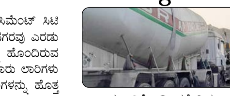
ಕಾಮಗಾರಿಗೆ ಅಡ್ಡಿ: ರಸ್ತೆ ನಿರ್ಮಾಣಕ್ಕೆ ಬಳಸುವ ಬುಲ್‌ಡೋಜರ್ ಹಾಗೂ ಇನ್ನಿತರ ಯಂತ್ರೋಪಕರಣಗಳನ್ನು ಸಹ ರಸ್ತೆಯ ಮೇಲೆಯೇ ಅಡ್ಡದಿಡ್ಡಿಯಾಗಿ ಬಿಡುತ್ತಿರುವುದು ಪಾದಚಾರಿಗಳಿಗೆ ಮತ್ತು ದ್ವಿಚಕ್ರ ವಾಹನ ಸವಾರರಿಗೆ ಕಿರಿಕಿರಿ ಉಂಟುಮಾಡುತ್ತಿದೆ. ಶಾಸಕರ ದೂರದೃಷ್ಟಿಗೆ ಲಾರಿ ಮಾಲೀಕರ ತಣ್ಣಗೆ: ಕ್ಷೇತ್ರದ ಶಾಸಕರೂ ಆಗಿರುವ ಸಚಿವ ಡಾ. ಶರಣಪ್ರಕಾಶ ಪಾಟೀಲ ಅವರು ಅತ್ಯಂತ ಮಹತ್ವಾಕಾಂಕ್ಷಿಯ ಚಿಕ್ಕಪುಟ್ಟ ರಸ್ತೆ ನಿರ್ಮಾಣ ಕಾರ್ಯಕ್ಕೆ ಚಾಲನೆ ನೀಡಿದ್ದಾರೆ. ಆದರೆ, ಈ ಅಭಿವೃದ್ಧಿ ಕೆಲಸಕ್ಕೆ ಸಹಕರಿಸಬೇಕಾದ ಲಾರಿ ಮಾಲೀಕರು ಮತ್ತು ಚಾಲಕರು ರಸ್ತೆಯನ್ನೇ ತಮ್ಮ ಖಾಸಗಿ ಪಾರ್ಕಿಂಗ್ ತಾಣವನ್ನಾಗಿ ಮಾಡಿಕೊಂಡಿರುವುದು ಸಾರ್ವಜನಿಕರ ಕಿರಾಣಿಗಾಗಿ ಗುರಿಯಾಗಿದೆ. ಈ ಬಗ್ಗೆ ಅಧಿಕಾರಿಗಳು ಗಮನಹರಿಸುವವರೆ...? ಪೊಲೀಸ್ ಇಲಾಖೆ ಮತ್ತು ಪುರಸಭೆ ಅಧಿಕಾರಿಗಳು ಈ ಬಗ್ಗೆ ತುರ್ತು ಗಮನಹರಿಸಿ, ರಸ್ತೆ ಬದಿಯಲ್ಲಿ ಅನಧಿಕೃತವಾಗಿ ಪಾರ್ಕಿಂಗ್ ಮಾಡುವ ವಾಹನಗಳ ವಿರುದ್ಧ ದಂಡ ವಿಧಿಸಬೇಕು. ಆಗ ಮಾತ್ರ ಶಾಸಕರ ಕನಸಿನ ಸುಗಮ ಸಂಚಾರದ ಯೋಜನೆ ಯಶಸ್ವಿಯಾಗಲು ಸಾಧ್ಯ ಎಂದು ಸಾರ್ವಜನಿಕರ ಅಶ್ವಯಜ್ಞರು ಸೇಡಂ ನಗರದ ರಸ್ತೆಗಳು ಆಗಲವಾಗುತ್ತವೆ ಎಂದು ಮಿಷಿ ಪಡುವಷ್ಟರಲ್ಲಿ, ಅರ್ಧ ರಸ್ತೆಯನ್ನು ಲಾರಿಗಳೇ ತಿನ್ನುತ್ತಿವೆ. ಸಂಬಂಧಪಟ್ಟ ಅಧಿಕಾರಿಗಳು ತಕ್ಷಣ ಕ್ರಮ ಕೈಗೊಂಡು ಈ ವಾಹನಗಳನ್ನು ತೆರವುಗೊಳಿಸಿ ಮುಂದೆ ಲಾರಿಗಳು ನಿಲ್ಲಿಸದಂತೆ ಎಚ್ಚರಿಕೆ ನೀಡಬೇಕು. ಆ ಮೂಲಕ ಮುಂದಾಗುವ ಅನಾಹುತ ತಪ್ಪಿಸಬೇಕು. ಆ ಮೂಲಕ ಮುಂದಾಗುವ ಅನಾಹುತ ತಪ್ಪಿಸಬೇಕು.

ಕಲಬುರಗಿ, ಮೇ. 16: ಜಿಲ್ಲೆಯ ಸಿಮೆಂಟ್ ಸಿಟಿ ಎಂದೇ ಖ್ಯಾತಿ ಪಡೆದಿರುವ ಸೇಡಂ ನಗರವು ಎರಡು ಬೃಹತ್ ಸಿಮೆಂಟ್ ಕಾರ್ಖಾನೆಗಳನ್ನು ಹೊಂದಿರುವ ನಗರವಾಗಿದೆ. ಸಿಮೆಂಟ್ ಹೊತ್ತ ಸೂರಾರು ಲಾರಿಗಳು ಮತ್ತು ಸಿಮೆಂಟ್ ಕಾಂಕ್ರೀಟ್ ಮಿಶ್ರಣಗಳನ್ನು ಹೊತ್ತ ಟ್ರ್ಯಾಕ್ಟರ್‌ಗಳು ನಿತ್ಯ ಸಾಲು ಸಾಲು ನಿಲ್ಲುವುದರಿಂದ ಚಿಕ್ಕಪುಟ್ಟ ರಸ್ತೆ ಕಾಮಗಾರಿ ನಡುವೆ ಅಡ್ಡದಿಡ್ಡಿ ವಾಹನ ಪಾರ್ಕಿಂಗ್, ಸಾರ್ವಜನಿಕ ಸುಗಮ ಸಂಚಾರಕ್ಕೆ ತೀವ್ರ ಸಂಚಾರಕ್ಕೆ ಉಂಟಾಗಿದೆ. ಸೇಡಂ ನಗರವನ್ನು ದಿನನಿರಂತರ ಬೆಳೆಯುತ್ತಿರುವ ಜನಸಂಖ್ಯೆ ಮತ್ತು ವಾಹನಗಳ ಒತ್ತಡವನ್ನು ಮನಗಂಡು, ಸಂಚಾರ ದಟ್ಟಣೆ ನಿವಾರಿಸುವ ಉದ್ದೇಶದಿಂದ ರಸ್ತೆ ನಿರ್ಮಾಣ ಕಾರ್ಯಕ್ಕೆ ಚಾಲನೆ ನೀಡಿದ್ದಾರೆ. ಆದರೆ, ರಸ್ತೆಯ ಕೆಲಸ ಪ್ರಗತಿಯಲ್ಲಿರುವಾಗಲೇ ಲಾರಿ ಮತ್ತು ಬುಲ್‌ಡೋಜರ್‌ಗಳ ಅಸಮರ್ಪಕ ಪಾರ್ಕಿಂಗ್‌ನಿಂದಾಗಿ ಸಾರ್ವಜನಿಕ ಸುಗಮ ಸಂಚಾರಕ್ಕೆ ಅಡ್ಡಿ ಉಂಟಾಗುತ್ತಿದೆ. ಪಾರ್ಕಿಂಗ್ ಕಿರಿಕಿರಿ-ಸಾರ್ವಜನಿಕ ಆಕ್ರೋಶ : ಸೇಡಂ ಪಟ್ಟಣದ ಪ್ರಮುಖ ರಸ್ತೆಗಳಲ್ಲಿ ಸಂಚರಿಸುವ ವಾಹನ ಸವಾರರು ಪ್ರತಿದಿನ ಹೈರಾಣಾಗುತ್ತಿದ್ದಾರೆ. ಚಿತ್ರದಲ್ಲಿ ಕಾಣುವಂತೆ, ರಸ್ತೆಯ ಒಂದು ಬದಿಯನ್ನು ಸಂಪೂರ್ಣವಾಗಿ ಬೃಹತ್ ಟ್ರ್ಯಾಕ್ಟರ್ ಮತ್ತು ಲಾರಿಗಳು ಆಕ್ರಮಿಸಿಕೊಂಡಿವೆ.