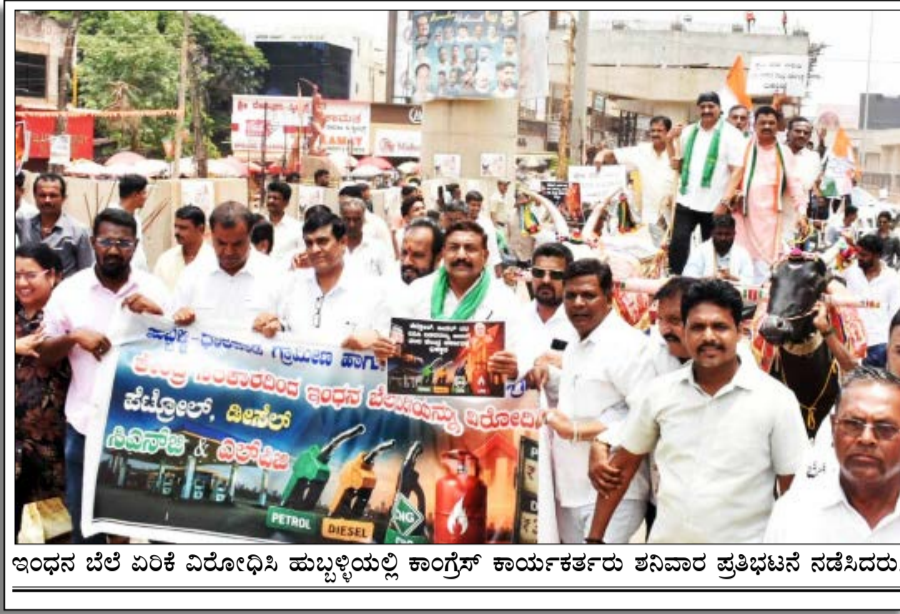
ಇಂಧನ ಬೆಲೆ ಏರಿಕೆ ವಿರೋಧಿಸಿ ಹುಬ್ಬಳ್ಳಿಯಲ್ಲಿ ಕಾಂಗ್ರೆಸ್ ಕಾರ್ಯಕರ್ತರು ಶನಿವಾರ ಪ್ರತಿಭಟನೆ ನಡೆಸಿದರು.