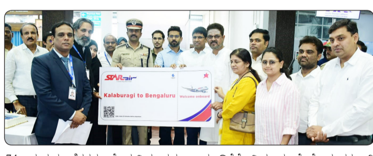
47 ಜನ ಪ್ರಯಾಣಿಕರನ್ನು ಹೊತ್ತ ವಿಮಾನವು ಬೆಳಿಗ್ಗೆ ಬೆಂಗಳೂರಿನಿಂದ 6.30ಕ್ಕೆ ಹೊರಟು 7.40ಕ್ಕೆ ಕಲಬುರಗಿ ವಿಮಾನ ನಿಲ್ದಾಣಕ್ಕೆ ಬಂದಿತ್ತು. ಅದೇ ರೀತಿ ಕಲಬುರಗಿಯಿಂದ 117 ಸಂಖ್ಯೆಯ ಸ್ಟಾರ್ ಏರ್ ವಿಮಾನವು ಬೆಳಿಗ್ಗೆ 8.10 ಗಂಟೆಗೆ 50 ಜನರನ್ನು ಹೊತ್ತು ಬೆಂಗಳೂರಿಗೆ ಪ್ರಯಾಣ ಬೆಳೆಸಿತು. ಇದರಿಂದ ಮತ್ತೆ ಆಗಸದಲ್ಲಿ ಪ್ರಯಾಣಿಸುವ ಸೌಭಾಗ್ಯ ಸ್ಥಳೀಯರಿಗೆ ಒಲಿದು ಬಂದಿದೆ.

ಕಲಬುರಗಿ, ಜೂ. 11: ಕಲಬುರಗಿ-ಬೆಂಗಳೂರು ನಡುವೆ ವಿಮಾನ ಸೇವೆ ಪುನರಾರಂಭಕ್ಕೆ ಶಾಸಕ ಎಂ.ವೈ.ಪಾಟೀಲ್ ಚಾಲನೆ ನೀಡಿದರು. ಸ್ಟಾರ್ ಏರ್ ಸಂಸ್ಥೆಯಿಂದ ವಿಮಾನ ಯಾನ ಸೇವೆ ಪುನರಾರಂಭವಾಗಿದ್ದು, ಕಲ್ಯಾಣ ಕರ್ನಾಟಕ ಪ್ರದೇಶವ್ಯವಸ್ಥಾ ಮಂಡಳಿಯ ಲೋಹದ ಹಕ್ಕಿ ಹಾರಾಟಕ್ಕೆ ಅರ್ಥಿಕ ನೆರವು ನೀಡುವ ಮೂಲಕ ವಿಮಾನಯಾನ ಸೇವೆ ಮತ್ತೆ ಆರಂಭಕ್ಕೆ ಕಾರಣವಾಗಿದೆ. ಎಂಟು ತಿಂಗಳ ಹಿಂದೆ ಸ್ಥಗಿತಗೊಂಡಿದ್ದ ವಿಮಾನ ಯಾನವನ್ನು ಪುನರಾರಂಭಿಸಿ, ಹೊಸಬೆಂಗಳೂರಿಗೆ ಪ್ರಯಾಣಿಸಿತು.