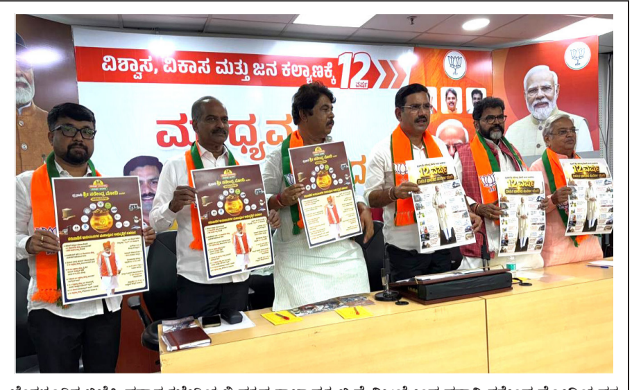
ಬೆಂಗಳೂರಿನ ಬಿಜೆಪಿ ಪ್ರಧಾನ ಕಛೇರಿಯಲ್ಲಿ ಪಕ್ಷದ ರಾಜ್ಯಾಧ್ಯಕ್ಷ ಬಿ.ವೈ.ವಿಜಯೇಂದ್ರ ಪ್ರಧಾನ ನೇರವೇ ಪ್ರಯೋಗದಿಂದ ತಮ್ಮ ಹುದ್ದೆಯಲ್ಲಿ 4399 ದಿನಗಳನ್ನು ಪೂರೈಸಿದ ಹಿನ್ನೆಲೆಯಲ್ಲಿ ಮಾಧ್ಯಮ ಸಂವಾದದಲ್ಲಿ ಪಾಲ್ಗೊಂಡರು. ಮಾಜಿ ಪ್ರಧಾನಿ ಪಂಡಿತ್ ಜವಾಹರ್ ಲಾಲ್ ನೆಹರು (4398 ದಿನಗಳು) ಅವರ ಹಿಂದಿನ ದಾಖಲೆಯನ್ನು ಮೋದಿ ಮೀರಿಸಿದ್ದಾರೆ ಎಂದು ವಿಜಯೇಂದ್ರ ಘೋಷಿಸಿದರು. ವಿಧಾನಸಭೆಯ ವಿರೋಧ ಪಕ್ಷದ ನಾಯಕ ಆರ್.ಅಶೋಕ, ಭಲವಾದಿ ನಾರಾಯಣ ಸ್ವಾಮಿ ಮತ್ತು ಸಂಸದರಾದ ಗೋವಿಂದ ಕಾರಜೋಳ ಮತ್ತು ಪಿ.ಸಿ.ಮೋಹನ್ ಹಾಗೂ ಇತರ ಮುಖಂಡರು ಉಪಸ್ಥಿತರಿದ್ದರು.

ಗ್ಯಾರಂಟಿ ಹೆಸರಲ್ಲಿ ಮತ ಪಡೆದು, ಅನರ್ಹ ಎಂದು ಹಕ್ಕು ಕಸಿಯುವ ಯತ್ನ ಶಕ್ತಿ ಯೋಜನೆ ಫಲಾನುಭವಿಗಳಿಗೆ ಬಯೋಮೆಟ್ರಿಕ್ ಹೆಸರಲ್ಲಿ ಕಿರುಕುಳ: ಸರ್ಕಾರದ ವಿರುದ್ಧ ಅಶೋಕ ವಾಗ್ಗಾಳ ಬೆಂಗಳೂರು, ಜೂ.11: ಗ್ಯಾರಂಟಿ ಎಂದು ಮತ ಪಡೆದು, ಅನರ್ಹ ಎಂದು ಹಕ್ಕು ಕಸಿಯುವ ಕಾಂಗ್ರೆಸ್ ಸರ್ಕಾರ ರಾಜ್ಯದ ತಾಯಂದಿರಿಗೆ ಉತ್ತರ ಕೊಡಲೇಬೇಕು ಎಂದು ವಿಧಾನಸಭೆ ಪ್ರತಿಪಕ್ಷದ ನಾಯಕ ಆರ್.ಅಶೋಕ ಆಗ್ರಹಿಸಿದ್ದಾರೆ. ತಮ್ಮ ಎಕ್ಸ್ ಖಾತೆಯಲ್ಲಿ ಈ ಬಗ್ಗೆ ಮಾಹಿತಿ ಪಂಚಕೋಡಿಯಿಂದ ಅವರು, ಸರ್ಕಾರದ ವಿರುದ್ಧ ವಾಗ್ಗಾಳಿ ನಡೆಸಿದ್ದು, ತಕ್ಷಣವೇ ಈ ಅನ್ಯಾಯವನ್ನು ನಿಲ್ಲಿಸಿ, ಅರ್ಹ ಫಲಾನುಭವಿಗಳಿಗೆ ಯಾವುದೇ ಗೊಂದಲವಿಲ್ಲದ ಯೋಜನೆಯ ಹಣ ಬಿಡುಗಡೆ ಮಾಡಬೇಕು, ಇಲ್ಲದಿದ್ದರೆ ತಾಯಂದಿರ ಶಾಪಕ್ಕೆ ಈ ಸರ್ಕಾರ ಸುಟ್ಟು ಭಸ್ಮವಾಗುವುದು ಗ್ಯಾರಂಟಿ ಎಂದು ಎಚ್ಚರಿಕೆ ಕೊಟ್ಟಿದ್ದಾರೆ. ಪೋಲಿಸ್ ಡ್ಯಾಂಟಿಂಗ್ ಮಹಿಳೆಯರನ್ನು ಬಳಸಿಕೊಂಡು, ಅಧಿಕಾರ ಸಿಕ್ಕಿ ಬಳಿಕ ಅವರ ಹಕ್ಕುಗಳನ್ನು ಕಸಿದುಕೊಳ್ಳುವ ಕಾಂಗ್ರೆಸ್‌ನ ಈ ದೃಢ ನಿಲಯವನ್ನು ಕರ್ನಾಟಕದ ಜನತೆ ಗಮನಿಸುತ್ತಿದ್ದಾರೆ. ಚುನಾವಣೆಗೂ ಮೊದಲು ಪ್ರತಿ ಮನೆಯ ಯಜಮಾನಿಗೂ 2,000 ರೂ. ಎಂದು ಭರವಸೆ, ಚುನಾವಣೆ ಬಳಿಕ ಅನರ್ಹರ ಪಟ್ಟಿ ಈಗ ಬಯೋಮೆಟ್ರಿಕ್ ಹೆಸರಲ್ಲಿ ಹೊಸ ಕಿರುಕುಳ, ಇದೇನಾ ಕಾಂಗ್ರೆಸ್‌ನ ಮಹಿಳಾ ಸಬಲೀಕರಣ ಎಂದು ಸರ್ಕಾರವನ್ನು ಪ್ರಶ್ನಿಸಿದ್ದಾರೆ.