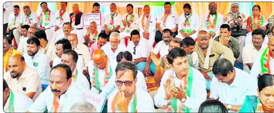
ರಾಯಚೂರು ನಗರದ ಅಂಬೇಡ್ಕರ್ ವೃತ್ತದಲ್ಲಿ ಕಾಂಗ್ರೆಸ್ ಕಾರ್ಯಕರ್ತರು ಮತ್ತು ಮುಖಂಡರು ಅಗತ್ಯ ವಸ್ತುಗಳ ಬೆಲೆ ಏರಿಕೆ ವಿರೋಧಿಸಿ ಪ್ರತಿಭಟನೆ ನಡೆಸಿದರು.