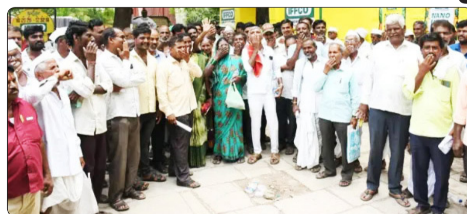
ಕಲಬುರಗಿ ಎಪಿಎಂಸಿ ಮುಂದೆ ಪ್ರತಿಭಟನೆ ನಡೆಸಿದ ಪ್ರಾಂತ ರೈತ ಸಂಘದ ಕಾರ್ಯಕರ್ತರು ರಯತರಿಗೆ ಸಮರ್ಪಕ ರಸಗೊಬ್ಬರ ಪೂರೈಕೆ ಮಾಡಿ ಎಂದು ಆಗ್ರಹಿಸಿದರು.

ಕಲಬುರಗಿ, ಜೂ. 11: ರೈತರಿಗೆ ರಸಗೊಬ್ಬರ ಕೊರತೆಯಾಗದಂತೆ ಕೇಂದ್ರ ರಾಜ್ಯ ಸರ್ಕಾರಗಳು ನೋಡಿಕೊಳ್ಳಬೇಕು, ಕೇಂದ್ರ ಸರ್ಕಾರ ಕಾಂಪ್ಲೆಕ್ಸ್ ಗೊಬ್ಬರಕ್ಕೆ ಸಹಾಯಧನ ನೀಡಬೇಕು ಎಂಬುದು ಸೇರಿ ವಿವಿಧ ಬೇಡಿಕೆ ಈಡೇರಿಕೆಗೆ ಆಗ್ರಹಿಸಿ, ಕರ್ನಾಟಕ ಪ್ರಾಂತ ರೈತಸಂಘದ ಕಾರ್ಯಕರ್ತರು ನಗರದ ಎಪಿಎಂಸಿ ಎದುರು ಧರಣಿ ನಡೆಸಿದರು. ರಸಗೊಬ್ಬರ ಕೊರತೆ ನೀಗಿಸಬೇಕು, ಪೆಟ್ರೋಲ್, ಡೀಸೆಲ್ ಬೆಲೆ ಇಳಿಕೆ ಮಾಡಬೇಕು, ವಿದ್ಯುತ್ ಶಾಸನೀಕರಣ ಕೈಬಿಡಬೇಕು ಎಂದು ಒತ್ತಾಯಿಸಿದರು. ರಸಗೊಬ್ಬರ ದುಬಾರಿ ಬೆಲೆಯಿಂದಾಗಿ ರೈತರು ತತ್ತರಿಸಿದ್ದಾರೆ. ರೈತರು ಪಹಣಿ, ಆಧಾರ್ ಕಾರ್ಡ್ ನೊಂದಿಗೆ ಎರಡು ದಿನ ಪಾಳೆಯಲ್ಲಿ ನಿಂತರೂ ಗೊಬ್ಬರ ದೊರೆಯುತ್ತಿಲ್ಲ. ರೈತರಿಗೆ ಕೃಷಿ ಸವಧದಲ್ಲಿ ನಡೆಯುತ್ತಿದೆ.