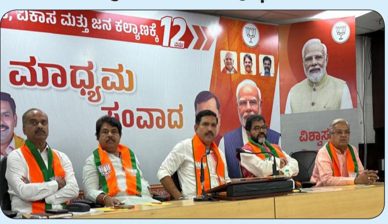
ಕಾರ್ಯ ನಡೆದಿಲ್ಲ; ಪರಿಷ್ಕರಣೆಗಾಗಿ ಮೀಸಲಿಟ್ಟ ಮುಖಂಡರನ್ನು ತೆಲಂಗಾಣಕ್ಕೆ ತೆಗೆದುಕೊಂಡು ಹೋಗಿ ದುರ್ಬಳಕೆ ಮಾಡಿದ್ದು ರಾಜ್ಯದ ಜನರ ಮುಂದಿದೆ ಎಂದು ಗಮನ ಸೆಳೆದರು. ಅಭಿವೃದ್ಧಿ ಶೂನ್ಯ ಕಾಂಗ್ರೆಸ್ ಸರ್ಕಾರವಿದ್ದು, ಇವರ ವೈಫಲ್ಯ ಮುಚ್ಚಿಕೊಳ್ಳಲು ಕೇಂದ್ರ ಸರ್ಕಾರ ದೂರು ಕೆಲಸ ಮಾಡುತ್ತಿದೆ ಎಂದು ಆರೋಪಿಸಿದರು. ಮಾಜಿ ಉಪಮುಖ್ಯಮಂತ್ರಿ ಮತ್ತು ಸಂಸದ ಗೋವಿಂದ ಕಾರಜೋಳ ಅವರು ಪ್ರಶ್ನೆಗೆ ಉತ್ತರಿಸಿ, ನೆಲೆಗಳಲ್ಲಿ ನೀರು ಬರಿಸುವ ಜವಾಬ್ದಾರಿ ರಾಜ್ಯ ಸರ್ಕಾರದ್ದು ಎಂದು ತಿಳಿಸಿದರು. ರಾಜ್ಯ ಸರ್ಕಾರಕ್ಕೆ ಜಲಜೀವನ್ ಯೋಜನೆಯಡಿ ಅನುದಾನ ನೀಡಲಾಗುತ್ತದೆ. ಆ ಹಣದ ಸಮಸ್ಯೆಯೇನೂ ಇಲ್ಲ, ಸುರಕ್ಷಿತ, ಶುದ್ಧವಾದ ಕುಡಿಯುವ ನೀರನ್ನು ಪ್ರತಿ ಮನೆಗೂ ಕೊಡುವ ಜವಾಬ್ದಾರಿ ರಾಜ್ಯ ಸರ್ಕಾರದ ಮೇಲಿದೆ ಎಂದು ತಿಳಿಸಿದರು.

ವೈಫಲ್ಯ ಮುಚ್ಚಿಕೊಳ್ಳಲು ಕೇಂದ್ರದ ವಿರುದ್ಧ ಬಿಜೆಪಿ ಮೂಡುತ್ತಿದೆ ರಾಜ್ಯ ಸರ್ಕಾರ: ಬಿ.ವೈ. ವಿಜಯೇಂದ್ರ ಆಕ್ಷೇಪ ಬೆಂಗಳೂರು, ಜೂ.11: ರಾಜ್ಯದ ಕಾಂಗ್ರೆಸ್ ಸರ್ಕಾರವು ತನ್ನ ವೈಫಲ್ಯ ಮುಚ್ಚಿ ಹಾಕುವ ಸಲುವಾಗಿ ಕೇಂದ್ರ ಸರ್ಕಾರ ಮಲತಾಯಿ ಧೋರಣೆ ಮಾಡುತ್ತಿದೆ; ಇನ್ನೂ ಮಾಡುತ್ರೆ ಇದೆ ಎಂದು ಪದೇಪದೇ ಪ್ರಸ್ತಾಪಿಸುತ್ತದೆ ಎಂದು ಬಿಜೆಪಿ ರಾಜ್ಯಾಧ್ಯಕ್ಷ ಮತ್ತು ಶಾಸಕ ಬಿ.ವೈ. ವಿಜಯೇಂದ್ರ ಆಕ್ಷೇಪಿಸಿದರು. ಬಿಜೆಪಿ ರಾಜ್ಯ ಕಾರ್ಯಾಲಯ ಜಗನ್ಮೂರ್ತಿಯವರ ಗುರುವಾರ ಆಯೋಜಿಸಿದ್ದ ಸಂವಾದ ಕಾರ್ಯಕ್ರಮದಲ್ಲಿ ಅವರು ಮಾಧ್ಯಮಗಳ ಪ್ರಶ್ನೆಗೆ ಉತ್ತರಿಸಿದರು. ವಾಸ್ತವಿಕ ಸತ್ಯ ಏನೆಂದರೆ, ಕಳೆದ 3 ವರ್ಷಗಳಲ್ಲಿ ರಾಜ್ಯದಲ್ಲಿ ಯಾವುದೇ ಅಭಿವೃದ್ಧಿ