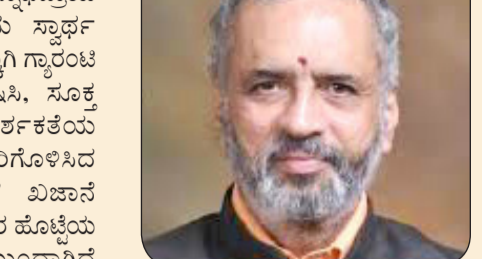
ಪಾರದರ್ಶಕತೆಯನ್ನು ಅಳವಡಿಸಿಕೊಂಡಿದ್ದರೆ, ಈಗ ಎದುರಾಗಿರುವ ಅರ್ಥಿಕ ಸಮಸ್ಯೆಗಳನ್ನು ತಪ್ಪಿಸಲು ಸಾಧ್ಯವಾಗುತ್ತಿತ್ತು. ಆದರೆ,

ಶಿರಸಿ, ಜೂ.16: ರಾಜ್ಯ ಕಾಂಗ್ರೆಸ್ ಸರ್ಕಾರವು ನ್ಯಾಯ ಯೋಜನೆಗಳ ಅನುಷ್ಠಾನ ನಿರ್ವಹಣೆಯಿಂದ ಕರ್ನಾಟಕವನ್ನು ಅರ್ಥಿಕ ದಿವಾಳಿತನದ ಪ್ರಪಾತಕ್ಕೆ ತಳ್ಳಿದ್ದು, ಈಗ ತನ್ನ ಅಡಳಿತಾತ್ಮಕ ವೈಫಲ್ಯಗಳನ್ನು ಮುಚ್ಚಿಕೊಳ್ಳಲು ಬಡವರ ಹಾಗೂ ಅರ್ಹ ಫಲಾನುಭವಿಗಳ ಹಕ್ಕುಗಳನ್ನು ಕಸಿಯುತ್ತಿರುವುದು ಎಂದು ಉತ್ತರ ಕನ್ನಡ ಸಂಸದ ವಿಶ್ವೇಶ್ವರ ಹೆಗಡೆ ಕಾಗೇರಿ ಆರೋಪಿಸಿದ್ದಾರೆ.