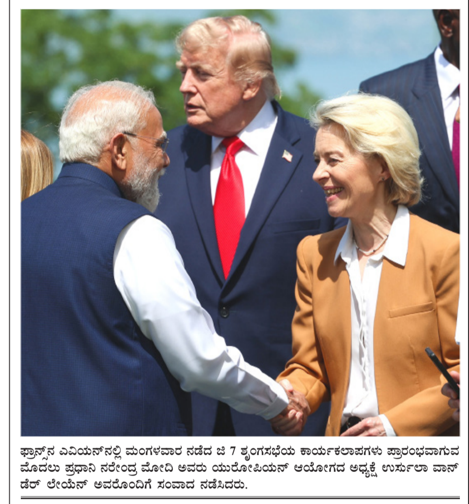
ಫ್ರಾನ್ಸ್‌ನ ಎವಿಯನ್‌ನಲ್ಲಿ ಮಂಗಳವಾರ ನಡೆದ ಜಿ7 ಶೃಂಗಸಭೆಯ ಕಾರ್ಯಕ್ರಮಗಳಿಗೆ ಪ್ರಾರಂಭವಾಗುವ ಮೊದಲು ಪ್ರಧಾನಿ ನರೇಂದ್ರ ಮೋದಿ ಅವರು ಯುರೋಪಿಯನ್ ಆಯೋಗದ ಅಧ್ಯಕ್ಷ ಉರ್ಸುಲಾ ವಾನ್ ಡೆರ್ ಲೇಯನ್ ಅವರೊಂದಿಗೆ ಸಂವಾದ ನಡೆಸಿದರು.

ಸಾಲ ಹೊಂದಿದವರಲ್ಲಿ 8.21 ಲಕ್ಷ ರೈತರ ಸಾಲ ತಲಾ 35,000 ರೂ. ಮನ್ನಾ ಆಗಲಿದೆ. ಇದು ಸಿಎಂ ವಿಜಯ್ ಸರ್ಕಾರ ಇದುವರೆಗೆ ಘೋಷಿಸಿದ ಅತಿದೊಡ್ಡ ರೈತಲ್ಯಾಣ ಕಾರ್ಯಕ್ರಮಗಳಲ್ಲಿ ಒಂದಾಗಿದೆ. ರಾಜ್ಯದ ರೈತರ ಆರ್ಥಿಕ ಸ್ಥಿತಿ ಮತ್ತು ರೈತರ ಅಗತ್ಯಗಳನ್ನು ನಿರ್ವಹಿಸಲು ಈ ನಿರ್ಧಾರ ತೆಗೆದುಕೊಳ್ಳಲಾಗಿದೆ. ಈ ಯೋಜನೆಯಡಿ ಸಹಕಾರಿ ಬ್ಯಾಂಕುಗಳಿಗೆ ಪಾವತಿಸಬೇಕಾದ ಪಾವತಿಗಳನ್ನು ಭಾರತೀಯ ರಿಸರ್ವ್ ಬ್ಯಾಂಕ್ ಮಾರ್ಗಸೂಚಿಗಳ ಅನುಗುಣವಾಗಿ 45 ರಿಂದ 60 ದಿನಗಳಲ್ಲಿ ಇತ್ಯರ್ಥಪಡಿಸುವ ಸಾಧ್ಯತೆಗಳಿವೆ.