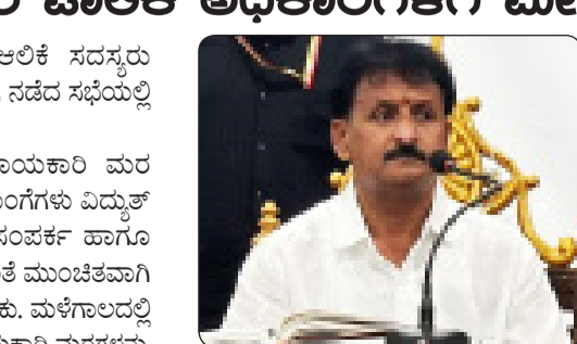
ಸಿಬ್ಬಂದಿ ಕಡ್ಡಾಯವಾಗಿ ಸುರಕ್ಷಿತ ಪರಿಕರಗಳನ್ನು ಧರಿಸಿ ಕಾರ್ಯ ನಿರ್ವಹಿಸಬೇಕು ಎಂದು. ಮಂಗಳಾಲದ ಸಂದರ್ಭದಲ್ಲಿ ಮಳೆಯಿಂದ ತಗ್ಗಿ ಪ್ರದೇಶಗಳಲ್ಲಿನ ಮನೆಗಳಿಗೆ ನೀರು