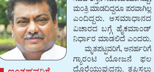
■ ಇಂತಹವರಿಗೆ ಕೊಡಿ ಎನ್ನಲಿ, ಹೈಕಮಾಂಡ್, ಸಿಎಂ ವಿವೇಚನೆಗೆ ಬಿಟ್ಟಿದ್ದು