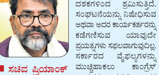
■ ಸಚಿವ ಪ್ರಿಯಾಂಕ ಖರ್ಗೆ ವಿರುದ್ಧ ಬಿಜೆಪಿ ನಾಯಕ ಭಲವಾದಿ ನಾರಾಯಣಸ್ವಾಮಿ ವಾಗ್ವಾಳಿ

ಬೆಂಗಳೂರು, ಜೂ.16: ರಾಷ್ಟ್ರೀಯ ಸ್ವಯಂಸೇವಕ ಸಂಘದ ಸೈದ್ಧಾಂತಿಕ ಹಿನ್ನೆಲೆ ಹಾಗೂ ದೇಶಭಕ್ತಿಯ ಕುರಿತು ಸಚಿವ ಪ್ರಿಯಾಂಕ ಖರ್ಗೆ ವ್ಯಕ್ತಪಡಿಸಿದ ನಿಲುವುಗಳ ವಿರುದ್ಧ ಫಲವಾದಿ ನಾರಾಯಣಸ್ವಾಮಿ ವಾಗ್ವಾಳಿ ನಡೆಸಿದ್ದಾರೆ. ಕಾಂಗ್ರೆಸ್ ಪಕ್ಷವು ಸದಾ ಸಂಘದ ವಿಚಾರದಲ್ಲಿ ಹಗಲಿನ ಸಾಧಿಸುತ್ತಾ ಬಂದಿದೆ. ಆರ್‌ಎಸ್‌ಎಸ್ ಯಾವುದೇ ರಾಜಕೀಯ ಲಾಭಕ್ಕಾಗಿ ಕೆಲಸ ಮಾಡುವ ಸಂಘಟನೆಯಲ್ಲ ಎಂಬುದನ್ನು ಸಚಿವರು ಅರ್ಥ ಮಾಡಿಕೊಳ್ಳಬೇಕು ಎಂದಿದ್ದಾರೆ. ಸಂಘಟನೆಯ ಇತಿಹಾಸ ಮತ್ತು