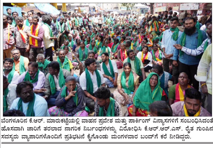
ಬೆಂಗಳೂರಿನ ಕೆ.ಆರ್. ಮಾರುಕಟ್ಟೆಯಲ್ಲಿ ವಾಹನ ಪ್ರವೇಶ ಮತ್ತು ಪಾರ್ಕಿಂಗ್ ವಿಸ್ತಾರಣೆಗೆ ಸಂಬಂಧಿಸಿದಂತೆ ಹೊಸದಾಗಿ ಜಾರಿಗೆ ತರಲಾದ ನಾಗರಿಕ ನಿರ್ಬಂಧಗಳನ್ನು ವಿರೋಧಿಸಿ ಕೆ.ಆರ್.ಆರ್.ಎಸ್. ರೈತ ಗುಂಪಿನ ಸದಸ್ಯರು ವ್ಯಾಪಾರಿಗಳೊಂದಿಗೆ ಪ್ರತಿಭಟನೆ ಕೈಗೊಂಡು ಮಂಗಳವಾರ ಬಂದ್‌ಗೆ ಕರೆ ನೀಡಿದ್ದರು.

ಮಾಡಬೇಕು ಎಂದು ಆಗ್ರಹಿಸಿದರು. ಬಾಕಿ ಇರುವ ನೌಕರರ ವೇತನ ಮತ್ತು ಪಿಎಫ್ ಹಣವನ್ನು ಸರ್ಕಾರ ವಸೂಲಿ ಮಾಡಬೇಕು ಅಥವಾ ವಂಚನೆಯ ಆರೋಪದ ಮೇಲೆ ಪ್ರಿಮನ್ಸ್ ಮೊಗದ್ದಮೆ ಹೂಡಬೇಕು. ಇಂತಹ ಕಳಂಕಿತ ವ್ಯಕ್ತಿಯನ್ನು ಸಿದ್ಧರಾಮಯ್ಯನವರು ತಮ್ಮ ಸಲಹೆಗಾರರಾಗಿ ನೇಮಕ ಮಾಡಿಕೊಂಡಿದ್ದು ಅಕ್ರಮ ಅಪರಾಧ. ಇವರಿಂದ ಸಾಲ ಪಡೆದು ಬ್ಯಾಂಕ್‌ಗಳಿಗೆ ಹೇಗೆ ಮೋಸ ಮಾಡಬಹುದು ಎಂಬುದರ ಬಗ್ಗೆ ಸಲಹೆ ನೀಡಬಲ್ಲವರಾಗಿದ್ದರು. ಈ ಕಳಂಕಿತ ವ್ಯಕ್ತಿಯಿಂದ ಯಾವ ಸಲಹೆ ಪಡೆದರು. ಟೋಪಿ ಇಡುವುದು ಅಥವಾ ನೌಕರರಿಗೆ ಪಂಗನಾಮ ಹಾಕುವುದು ಇಲ್ಲವೇ ಬ್ಯಾಂಕ್‌ಗಳಿಗೆ ವಂಚನೆಯ ದಾರಿಯ ಸಲಹೆ ಪಡೆಯಲಾಯಿತು, ಸಾರ್ವಜನಿಕರ ತೆರಿಗೆ ಹಣ ಮತ್ತು ಬ್ಯಾಂಕ್ ಹಣಕ್ಕೆ ವಂಚನೆ ಮಾಡಿದ್ದಾರೆ ಎಂದರು. ರಾಹುಲ್ ಗಾಂಧಿಯವರು ಕಂಡ ಕಂಡವರನ್ನೆಲ್ಲಾ 'ಟೋಪಿ' ಎಂದು ಕರೆಯುತ್ತಾರೆ, ಆದರೆ ತಮ್ಮದೇ ಪಕ್ಷದ ನಾಯಕನೊಬ್ಬ 1,454 ಕೋಟಿ ವಂಚನೆ ಮಾಡಿರುವ ಬಗ್ಗೆ ಉಸಿರುತ್ತಿಲ್ಲ. ಕಾಂಗ್ರೆಸ್ ಇವರನ್ನು ಕೂಡಲೇ ಪ್ರಾಥಮಿಕ ಸದಸ್ಯತ್ವದಿಂದ ವಜಾ ಮಾಡಬೇಕು. ಇತ್ತೀಚಿನ ದಿನಗಳಲ್ಲಿ ಕಾಂಗ್ರೆಸ್ ಪಕ್ಷದ ವಂಚಕರು, ಅಪ್ಯಾಚಾರಿಗಳು ಮತ್ತು ಕೊಲೆ ಗಡುಕರು ಕೋರ್ಟಿನಲ್ಲಿ ಶಿಕ್ಷೆಗೆ ಒಳಪಡುತ್ತಿದ್ದಾರೆ. ಆದರೆ ಪಾರ್ಟಿ ಮಾತ್ರ ಅವರ ಮೇಲೆ ಯಾವುದೇ ಕ್ರಮ ಜರುಗಿಸದೆ ಪರೋಕ್ಷವಾಗಿ ಅವರ ಕಾನೂನುಬಾಹಿರ ಕೃತ್ಯಗಳಿಗೆ ಉತ್ತೇಜನ ನೀಡುತ್ತಿದೆ. ಕೂಡಲೇ ಕಾಂಗ್ರೆಸ್ ಓಟು ಬ್ಯಾಂಕ್ ರಾಜಕಾರಣ ಮಾಡದೆ, ನಸೀರ್ ಅಹ್ಮದ್ ರವರನ್ನು ಅಮಾನತ್ತು ಮಾಡಬೇಕು ಎಂದು ಒತ್ತಾಯಿಸುತ್ತೇವೆ.