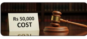
ಸಲ್ಲಿಸಲಾಗಿರುವ ಕ್ಷುಲ್ಲಕ ಅರ್ಜಿಯಾಗಿದೆ. ಇಂಥ ಅರ್ಜಿ ಸಲ್ಲಿಸುವ ಮೂಲಕ ನ್ಯಾಯಾಲಯದ ಅಮೂಲ್ಯ ಸಮಯ ವ್ಯರ್ಥ ಮಾಡಲಾಗಿದೆ ಎಂದು ಅಸಮಾಧಾನ ವ್ಯರ್ಥ ಮಾಡಲಾಗಿದೆ ಎಂದು ಅಸಮಾಧಾನ ವ್ಯಕ್ತಪಡಿಸಿ, ಅರ್ಜಿದಾರರಿಗೆ 50 ಸಾವಿರ ರೂ. ದಂಡ ವಿಧಿಸಿ ಅರ್ಜಿ ವಜಾಗೊಳಿಸಿ ಆದೇಶಿಸಿತು.

ಬೆಂಗಳೂರು, ಜೂ.16: ಮುಖ್ಯಮಂತ್ರಿ ಡಿ.ಕೆ. ಶಿವಕುಮಾರ್ ನೇತೃತ್ವದ 14 ಮಂದಿ ಸಚಿವರ ಪ್ರಮಾಣ ವಚನ ಸ್ವೀಕಾರ ಹಾಗೂ ಮಂತ್ರಿಮಂಡಲದ ರಚನೆ ಸಂವಿಧಾನಬಾಹಿರವೆಂದು ಘೋಷಿಸುವಂತೆ ಕೋರಿ ಸಲ್ಲಿಕೆಯಾಗಿದ್ದ ಅರ್ಜಿ ವಜಾಗೊಳಿಸಿರುವ ಹೈಕೋರ್ಟ್, ಅರ್ಜಿದಾರರಿಗೆ 50 ಸಾವಿರ ರೂ. ದಂಡ ವಿಧಿಸಿದೆ.