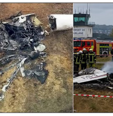
ಮತ್ತು ಐದು ಬೋಧಕರು ಸೇರಿದಂತೆ 10 ಪ್ರಯಾಣಿಕರು ಸೇರಿದ್ದಾರೆ ಎಂದು ಸ್ಥಳೀಯ ಅಧಿಕಾರಿಗಳು ತಿಳಿಸಿದ್ದಾರೆ. ಪ್ರಾದೇಶಿಕ ಪೊಲೀಸ್ ಇಲಾಖೆಯು ಸುಗುಂ, ವಿಮಾನವು

ಪ್ಯಾರಿಸ್, ಜೂ.28: ಕಶಾನ್ಯ ಫ್ರಾನ್ಸ್‌ನ ಟೊಂಬೆನ್ ಪಟ್ಟಣದಲ್ಲಿ ಭಾನುವಾರ ಸ್ಪೈಡ್ರಿಂಗ್‌ಗಳನ್ನು ಹೊತ್ತೊಯ್ಯುತ್ತಿದ್ದ ಲವ್ ವಿಮಾನವು ಟೀಕ್ ಆಫ್ ಅದ ಕೆಲವೇ ನಿಮಿಷಗಳ ನಂತರ ಪತನಗೊಂಡಿದ್ದು, ಪೈಲಟ್ ಸೇರಿದಂತೆ ಕನಿಷ್ಠ 11 ಜನರು ಸಾವನ್ನಪ್ಪಿದರು ಎಂದು ಸ್ಥಳೀಯ ಅಧಿಕಾರಿಗಳು ತಿಳಿಸಿದ್ದಾರೆ. ಪ್ಯಾರಾಶೂಟ್‌ಗಳು ಶಾಲೆಯಿಂದ ನಿರ್ವಹಿಸಲ್ಪಡುವ ಈ ವಿಮಾನವು ಸ್ಥಳೀಯ ಸಮಯ ಬೆಳಿಗ್ಗೆ 11 ಗಂಟೆ ಸುಮಾರಿಗೆ ಮ್ಯೂರ್ಫ್-ಎಕ್ಸ್-ಮೊಸೆಲ್ ಇಲಾಖೆಯ ನ್ಯಾನ್ಸಿ-ಎಸ್ಪಿ ವಾಯುಸೇನೆಯ ಬಳಿ ಪತನಗೊಂಡಿತು. ಬಲಿಯಾದವರಲ್ಲಿ ಪೈಲಟ್ ಮತ್ತು ಐದು ವಿದ್ಯಾರ್ಥಿ ಸ್ಪೈಡ್ರಿಂಗ್‌ಗಳು