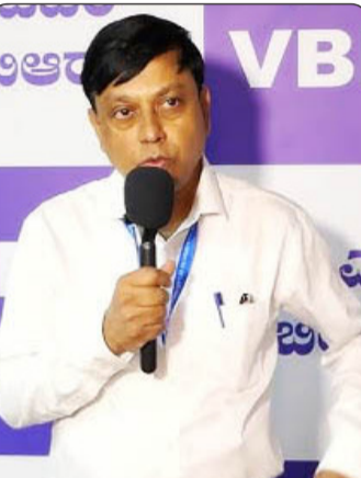
ಮೃತರ ಕುಟುಂಬಕ್ಕೆ ಪರಿಹಾರ ಒದಗಿಸಲು ಕ್ರಮ ವಹಿಸಲಾಗಿದೆ. ಕಾರ್ಮಿಕರ ವೇಳೆ ಗುತ್ತಿಗೆದಾರರು ಹಾಗೂ ಕಾರ್ಮಿಕರು ಎಲ್ಲಾ ಸುರಕ್ಷತಾ ಕ್ರಮಗಳನ್ನು ಖಚಿತಪಡಿಸಿಕೊಳ್ಳುವಂತೆ ಕಟ್ಟುನಿಟ್ಟಾಗಿ ಸೂಚನೆ ನೀಡಲಾಗಿದೆ ಎಂದು ತಿಳಿಸಿದರು.