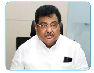
ಎಲೆಕ್ಟ್ರಾನಿಕ್ಸ್ ತಯಾರಿಕಾ ವಲಯದಲ್ಲೇ ಕೊರತೆ ನೀಡಿಸಲು ಮೆಗಾ ಕ್ಯಾಂಪಸ್