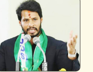
ಪ್ರತಿಕ್ರಿಯಿಸಿರುವ ನಿಖಿಲ್ ಕುಮಾರಸ್ವಾಮಿ, "ರಾಜಕೀಯ ದ್ವೇಷಕ್ಕಾಗಿ ವಿರೋಧ ಪಕ್ಷದ ಕಾರ್ಯಕರ್ತರನ್ನು ಹತ್ತಿಕ್ಕುವ ಸರ್ಕಾರದ ಇಂತಹ ಪ್ರಯತ್ನಗಳನ್ನು ನಾವು ಎಂದಿಗೂ ಸಹಿಸುವುದಿಲ್ಲ ಎಂದು ಎಚ್ಚರಿಸಿದ್ದಾರೆ. ಬಂಧಿತ ಕಾರ್ಯಕರ್ತನಿಗೆ ಜಿಡಿಎಸ್ ಪಕ್ಷದಿಂದ ಸಂಪೂರ್ಣ ಕಾನೂನು ಬೆಂಬಲ ನೀಡುವುದಾಗಿ ಘೋಷಿಸಿರುವ ಅವರು, ಕಾನೂನು ಎಲ್ಲರಿಗೂ ಒಂದೇ ಆಗಿದ್ದು, ತಮ್ಮ ಪಕ್ಷದ ಕಾರ್ಯಕರ್ತನಿಗೆ ನ್ಯಾಯ ಸಿಗುವವರೆಗೂ ವಿಶ್ರಮಿಸುವುದಿಲ್ಲ ಎಂದು ಹೇಳಿದ್ದಾರೆ.

ಬೆಂಗಳೂರು, ಜೂ.28: ಶಾಸಕ ಪ್ರದೀಪ್ ಈಶ್ವರ್ ಅವರ ಕಾರಿನ ಮೇಲೆ ಚಪ್ಪಲಿ ಎಸೆದ ಪ್ರಕರಣಕ್ಕೆ ಸಂಬಂಧಿಸಿದಂತೆ ಜಿಡಿಎಸ್ ಕಾರ್ಯಕರ್ತನನ್ನು ಪೊಲೀಸರು ಬಂಧಿಸಿರುವುದನ್ನು ಜಿಡಿಎಸ್ ಯುವ ಘಟಕದ ರಾಜ್ಯಾಧ್ಯಕ್ಷ ನಿಖಿಲ್ ಕುಮಾರಸ್ವಾಮಿ ಖಂಡಿಸಿದ್ದು, ಕಾಂಗ್ರೆಸ್ ಸರ್ಕಾರವು ಆಡಳಿತ ಯಂತ್ರವನ್ನು ದುರುಪಯೋಗಪಡಿಸಿ ಕೊಂಡು ವಿರೋಧ ಪಕ್ಷದ ಧ್ವನಿಯನ್ನು ಹತ್ತಿಕ್ಕಲು ಪ್ರಯತ್ನಿಸುತ್ತಿದೆ ಎಂದು ಆರೋಪಿಸಿದ್ದಾರೆ.