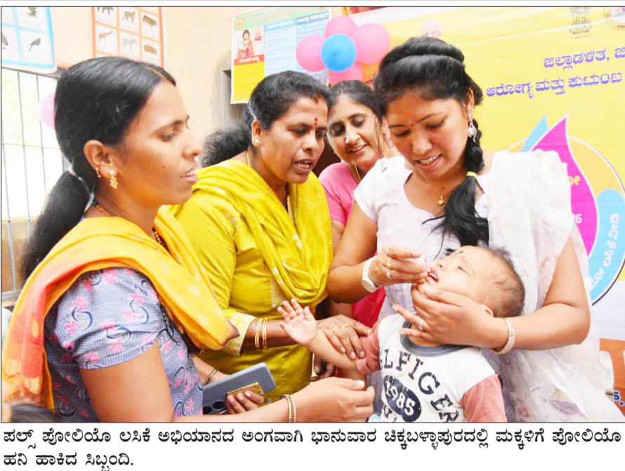
ಪಲ್ಸ್ ಪೋಲಿಯೋ ಲಸಿಕೆ ಅಭಿಯಾನದ ಅಂಗವಾಗಿ ಭಾನುವಾರ ಚಿಕ್ಕಬಳ್ಳಾಪುರದಲ್ಲಿ ಮಕ್ಕಳಿಗೆ ಪೋಲಿಯೋ ಹೆಚ್ಚಿನ ಸಿಬ್ಬಂದಿ.