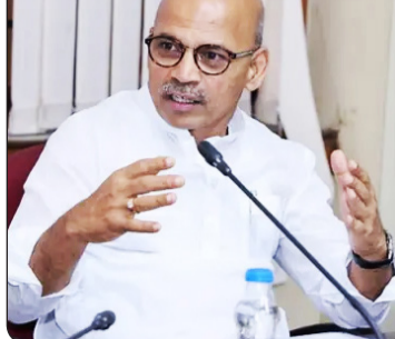
ಕಾರವಾರದಲ್ಲಿ ಸೂಪರ್ ಸ್ಪೆಷಾಲಿಟಿ ಆಸ್ಪತ್ರೆ ನಿರ್ಮಾಣಕ್ಕೆ ಸಚಿವ ಸಂಪುಟದ ಅನುಮತಿ ಈಗಾಗಲೇ ದೊರೆತಿದೆ. ಅತಿ ಶ್ರೀಘ್ರ ಚಿಂಡಕರಿಯಲಾಗುವುದು. ಅರ್ಜಿಯ ಆಸ್ಪತ್ರೆ ಕಟ್ಟಡ ಪೂರ್ಣಗೊಂಡಿದ್ದು ಉದ್ಘಾಟನೆ ಸಿದ್ಧವಾಗಿದೆ. ಇಂದಿರಾಗಾಂಧಿ ಜೈಲ್ ಕೇರ್ ಇನ್‌ಸ್ಟಿಟ್ಯೂಟ್, ದಯಾಬಿಜಲಾಪಿ ಕೇಂದ್ರ ಕಟ್ಟಡ ಕಾಮಗಾರಿಯೂ ಪ್ರಗತಿಯಲ್ಲಿದೆ ಎಂದರು.