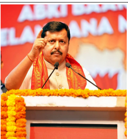
ಭಾನುವಾರ ಹೈದರಾಬಾದ್‌ನ ಪ್ರದರ್ಶನಮೈದಾನದಲ್ಲಿ GHMC ಯ ಮತಗಳಿಗೆ ಅಧ್ಯಕ್ಷರೊಂದಿಗೆ ನಡೆದ ಸಭೆಯಲ್ಲಿ ಬಿಜೆಪಿ ರಾಷ್ಟ್ರೀಯ ಅಧ್ಯಕ್ಷ ನಿತಿಶ್ ನಬಿನ್ ಅವರು ಸಭೆಯನ್ನು ದ್ವೇಷಿಸಿ ಮಾತನಾಡಿದರು.

ಐನ್ಫೋ ಟಾಟಾ ರೈತ ಸಂಘ: ಅಭಿವೃದ್ಧಿಗಾಗಿ ಹೆಜ್ಜೆ ಹಾಕಿತು - ಪು.6