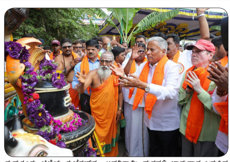
ತುಮಕೂರು ಜಿಲ್ಲೆಯ ಕುಣಿಗಲ್ ಅಡವಿ ಸ್ವಾಮಿ ಮಠದಲ್ಲಿ ಭಾನುವಾರ ಜರುಗಿದ ಬಸವ ಜಯಂತೋತ್ಸವ ಸಮಾರಂಭದಲ್ಲಿ ಪಾಲ್ಗೊಂಡ ಕೇಂದ್ರ ಸಚಿವ ವಿ.ಸೋಮಣ್ಣ ಬಸವೇಶ್ವರಿಗೆ ಗೌರವ ನಮನ ಸಲ್ಲಿಸಿದರು.

ಚುರುಕಿನಿಂದ ಸಾಗಿದೆ. ಇಂತಹ ಪವಿತ್ರ ಸ್ಥಳದಲ್ಲಿ ಈ ರೀತಿಯ ಘಟನೆಗಳು ನಡೆದಾಗ ದೇಶದ ಇತಿಹಾಸಕ್ಕೆ ಎಲ್ಲೋ ಒಂದು ಕಡೆ ಕಷ್ಟ ಚುಕ್ಕೆ ಇಟ್ಟಂತಾಗುತ್ತದೆ ಎಂದು ವಿಷಾದ ವ್ಯಕ್ತಪಡಿಸಿದರು. ಹೆಚ್‌ಕೆ ಬಿಡ್ಡು ಯೋಜನೆ ಜಾರಿ ಸರಿಯಲ್ಲ ಇದೇ ವೇಳೆ ಬಿಡದಿ ಔನಶಿವ್ ವಿವಾದದ ಕುರಿತು ರಾಜ್ಯ ಸರ್ಕಾರದ ವಿರುದ್ಧ ವಾಗ್ದಾಳಿ ನಡೆಸಿದ ಸೋಮಣ್ಣ, ತಾವು ಈ ಒಂದೆ ಸಚಿವರಾಗಿದ್ದು ಅವಧಿಯಲ್ಲಿ ಸೂರ್ಯನಗರದ ವಿವಿಧ ಹಂತಗಳ ಲೇಔಟ್‌ಗಳನ್ನು ಯಾವುದೇ ರೈತರಿಗೆ ಅನ್ಯಾಯವಾಗದಂತೆ ಯಶಸ್ವಿಯಾಗಿ ಮಾಡಿದ್ದನ್ನು ಸೋಮಣ್ಣ ನೆನಪಿಸಿಕೊಂಡರು. ಈ ಒಂದೆ ಎಚ್.ಡಿ. ಕುಮಾರಸ್ವಾಮಿ ಅವರು ಮೊದಲ ಬಾರಿ ಮುಖ್ಯಮಂತ್ರಿ ಯಾಗಿದ್ದಾಗ ಬಿಡದಿಯಲ್ಲಿ ಔನಶಿವ್ ಮಾಡುವ ಆಲೋಚನೆ ಹೊಂದಿದ್ದರು.