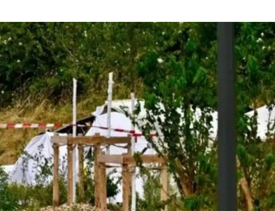
ಗಲ್ಫ್ ಕರಾವಳಿಯಲ್ಲಿರುವ ಪ್ರಮುಖ ಹೆಲಿಕಾಪ್ಟರ್ ಪತನಗೊಂಡಿದೆ. ವಿಮಾನ ಅಪಘಾತಕ್ಕೆ ಕಾರಣವಾದ ಕೇಂದ್ರವಾದ ರಾಸ್ ತನುರಾದಲ್ಲಿ

ರಿಯಾಡ್, ಜೂ.28: ಸೌದಿ ತೈಲ ದೈತ್ಯ ಅರಾಮ್‌ನ ನಿರ್ವಹಿಸುತ್ತಿದ್ದ ಹೆಲಿಕಾಪ್ಟರ್ ಭಾನುವಾರ ಸೌದಿ ಅರೇಬಿಯಾದ ಪೂರ್ವ ಸಾಗರದ ರಾಸ್ ತನುರಾದಲ್ಲಿ ಪತನಗೊಂಡಾಗ ವಿಮಾನದಲ್ಲಿ ಹದಿನಾಲ್ಕು ಜನರು ಸಾವನ್ನಪ್ಪಿದ್ದಾರೆ ಎಂದು ರಾಜ್ಯ ಸುದ್ದಿ ಸಂಸ್ಥೆ ಎಸ್‌ಪಿಎ ತಿಳಿಸಿದೆ. ಬಲಿಯಾದವರಲ್ಲೂ ಸೌದಿ ಪ್ರಜೆಗಳು ಎಂದು ಸೌದಿ ಇಂಧನ ಸಚಿವಾಲಯದ ಅಧಿಕೃತ ಮೂಲವನ್ನು ಉಲ್ಲೇಖಿಸಿ ಎಸ್ಪಿಎ ತಿಳಿಸಿದೆ. ಸೌದಿ ಅರೇಬಿಯಾದ