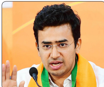
ಉಪನಗರ ರೈಲ್ವೆ ಜಾಲದ ಅಗತ್ಯವಿದೆ ಪೋಸ್ಟ್ ಮಾಡಿ ಆಕ್ರೋಶ ವ್ಯಕ್ತಪಡಿಸಿದ್ದಾರೆ.

ಬೆಂಗಳೂರು ನಗರದ ಸಂಚಾರ ದಟ್ಟಣೆಗೆ ಮೇಲ್ವಿಚಾರಣೆ ಈ ಸುರಂಗಗಳೂ ವಿಫಲವಾಗಿದ್ದು, ಸಾರ್ವಜನಿಕ ಸಾರಿಗೆಯೊಂದೇ ಇದಕ್ಕೆ ಸೂಕ್ತ ಪರಿಹಾರವಾಗಿದೆ. ಸರ್ಕಾರ ರೆಡ್ ಲೈನ್ ಮೆಟ್ರೋ ಕಾಮಗಾರಿ ವೇಗ ನೀಡಬೇಕೆಂದು ಸಚಿವ ಕೃಷ್ಣ ಭೈರೇಗೌಡ ಅವರೇ ಹಿಂದೆ ಸಣ್ಣ ಮೇಲ್ವಿಚಾರಣೆ ಮಾಡಿತ್ತು. ಹೀಗಿರುವಾಗ ಸಣ್ಣ ಸುರಂಗಗಳು ಹೇಗೆ ಸಹಕಾರಿಯಾಗುತ್ತವೆ. ಬೆಂಗಳೂರು ದಕ್ಷಿಣ ಭಾಗದಲ್ಲಿ ಉದ್ದೇಶಿಸಿರುವ ಇಂತಹ ಅನುಭವದಿಂದ ದೂರ ಸುರಂಗ ಮಾರ್ಗ ಯೋಜನೆಗಳನ್ನು ನಾವು ಯಾವುದೇ ಕಾರಣಕ್ಕೂ ಅನುಮತಿಸುವುದಿಲ್ಲ. ನಗರಕ್ಕೆ ಸದ್ಯ ಮೆಟ್ರೋ, ಬಸ್ ಹಾಗೂ