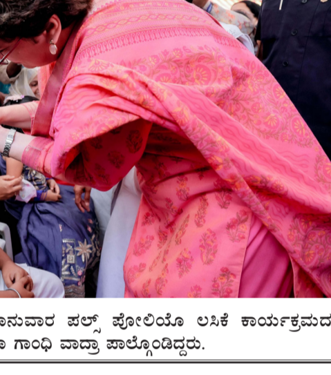
ಕೇರಳದ ಕಲೆಟ್ನಾದ ಪದವಿಪರೀಕ್ಷೆಯಲ್ಲಿ ಭಾನುವಾರ ಪಲ್ ಪೋಲಿಯೋ ಲಸಿಕೆ ಕಾರ್ಯಕ್ರಮದ ಉದ್ಘಾಟನೆಯಲ್ಲಿ ಕಾಂಗ್ರೆಸ್ ಸಂಸದ ಪ್ರಿಯಾಂಕಾ ಗಾಂಧಿ ವಾದ್ರಾ ಪಾಲ್ಗೊಂಡಿದ್ದರು.

ಮತ್ತು ದತ್ತು ಸ್ವೀಕಾರದಂತಹ ವಿಷಯಗಳಲ್ಲಿ ಧರ್ಮ ಅಧಾರಿತ ವೈಯಕ್ತಿಕ ಕಾನೂನುಗಳನ್ನು ಎಲ್ಲಾ ನಾಗರಿಕರಿಗೆ ಅನ್ವಯಿಸುವ ಸಾಮಾನ್ಯ ಕಾನೂನು ಚೌಕಟ್ಟಿನೊಂದಿಗೆ ಬದಲಾಯಿಸಲು ಮತ್ತು ಕೆಲವು ವರ್ಗಗಳಿಗೆ ಅಭ್ಯವಿರುವ ಸಾಂವಿಧಾನಿಕ ವಿನ್ಯಾಸಗಳನ್ನು ಉಳಿಸಿಕೊಳ್ಳಲು ಈ ಶಾಸನ ಪ್ರಯತ್ನಿಸುತ್ತದೆ. ಮುಖ್ಯಮಂತ್ರಿ ಸುವೇಂದ್ರ ಅಧಿಕಾರ ಉತ್ತರಾಧಿಕಾರಿಗಳಿಗೆ ಪ್ರಸ್ತುತ ಅಧಿವೇಶನದಲ್ಲಿ ಶಾಸನದೊಂದಿಗೆ ಮುಂದುವರಿಯುವ ಉದ್ದೇಶವನ್ನು ಸೂಚಿಸಿದರು. "ಗುಜರಾತ್, ಉತ್ತರಾಖಂಡ ಮತ್ತು ಅಸ್ಸಾಂನಲ್ಲಿ ಕಾರ್ಯವಿಧಾನವನ್ನು ಅನುಸರಿಸುವ ಮೂಲಕ, ಪಶ್ಚಿಮ ಬಂಗಾಳದಲ್ಲಿಯೂ ಕಾನೂನನ್ನು ಜಾರಿಗೆ ತರಲಾಗುವುದು ಈ ಬಗ್ಗೆ ಸೋಮವಾರ ನಾನು ವಿಧಾನಸಭೆಗೆ ತಿಳಿಸುತ್ತೇನೆ" ಎಂದು ಅವರು ಹೇಳಿದರು.