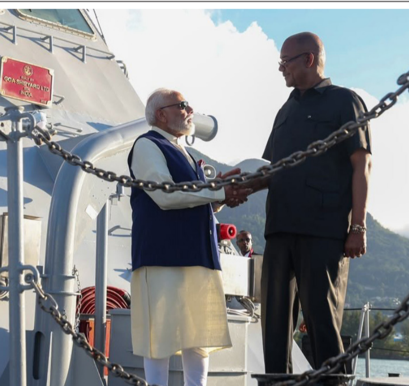
ಪ್ರಧಾನಿ ನರೇಂದ್ರ ಮೋದಿ ಅವರು 'ಮೇಡ್ ಇನ್ ಇಂಡಿಯಾ' ವೇಗದ ಗಸ್ತು ನೌಕೆ 'ಪಿಎಸ್ ಲೆಸ್ಲಾ' ಅನ್ನು ಸೆಶೆಲ್ಸ್ ಅಧ್ಯಕ್ಷ ಡಾ. ಪ್ಯಾಟ್ರಿಕ್ ಹೆಮೆನ್ ಅವರಿಗೆ ಹಸ್ತಾಂತರಿಸಿದರು. ಈ ನೌಕೆಯು ಸೆಶೆಲ್ಸ್ ಕಡಲ ಕಣ್ಗಾವಲು ಮತ್ತು ವಿಶೇಷ ಆರ್ಥಿಕ ವಲಯ ಗಸ್ತು ಸಾಮರ್ಥ್ಯವನ್ನು ಬಲಪಡಿಸಲು ನೆರವಾಗಲಿದೆ.

ಅವರು ಭೂತಾನ್, ನೇಪಾಳ, ಆಸ್ಟ್ರೇಲಿಯಾ ಮತ್ತು ಫಿಜಿ ಸಂಸತ್ತುಗಳನ್ನು ಉದ್ದೇಶಿಸಿ ಮಾತನಾಡಿದರು. 2015 ರಲ್ಲಿ, ಅವರು ಮಾರಿಷಸ್ ರಾಷ್ಟ್ರೀಯ ಸಭೆ ಮತ್ತು ಶ್ರೀಲಂಕಾ, ಮಂಗೋಲಿಯಾ, ಟ್ರಿನ್ಸಿಡೆ ಮತ್ತು ಅಫ್ಘಾನಿಸ್ತಾನ ಸಂಸತ್ತುಗಳ ಮುಂದೆ ಮಾತನಾಡಿದರು. 2016 ರಲ್ಲಿ, ಅವರು ಯುನೈಟೆಡ್ ಸ್ಟೇಟ್ಸ್ ಕಾಂಗ್ರೆಸ್ ಅನ್ನು ಉದ್ದೇಶಿಸಿ ಮಾತನಾಡಿದರು ಮತ್ತು 2023 ರಲ್ಲಿ ಎರಡು ಬಾರಿ ಯುಎಸ್ ಕಾಂಗ್ರೆಸ್ ಜಂಟಿ ಅಧಿವೇಶನವನ್ನು ಉದ್ದೇಶಿಸಿ ಮಾತನಾಡಲು ಮರಳಿದರು. ಆ ಮಹತ್ವದ ಘಟನೆಗಳ ನಡುವೆ, ಅವರು 2018 ರಲ್ಲಿ ಉಗಾಂಡಾ, 2019 ರಲ್ಲಿ ಮಾಲ್ಡೀವ್ಸ್ ಮತ್ತು 2024 ರಲ್ಲಿ ಗಯಾನಾ ಸಂಸತ್ತುಗಳನ್ನು ಉದ್ದೇಶಿಸಿ ಮಾತನಾಡಿದರು. 2025 ರಲ್ಲಿ ಫ್ರಾನ್ಸಾ, ಟ್ರಿನ್ಸಿಡಾಡ್ ಮತ್ತು ಟೊಬಾಗೊ ಮತ್ತು ನಮೀಬಿಯಾ ರಾಷ್ಟ್ರೀಯ ಸಂಸತ್ತುಗಳಿಗೆ ಮಾಡಿದ ಭಾಷಣಗಳೊಂದಿಗೆ ಮತ್ತು ಡಿಸೆಂಬರ್‌ನಲ್ಲಿ ಇಥಿಯೋಪಿಯನ್ ಸಂಸತ್ತಿನ ಜಂಟಿ ಅಧಿವೇಶನದೊಂದಿಗೆ ಈ ಅವೇಗ ಮುಂದುವರೆಯಿತು, ಇದು ಅಫ್ರಿಕಾ ಮತ್ತು ಜಾಗತಿಕ ದಕ್ಷಿಣದೊಂದಿಗೆ ಭಾರತದ ವಿಸ್ತರಿಸುತ್ತಿರುವ ಸಂಬಂಧವನ್ನು ಪ್ರತಿಬಿಂಬಿಸುತ್ತದೆ. ಈ ವರ್ಷದ ಆರಂಭದಲ್ಲಿ, ಫೆಬ್ರವರಿ 25, 2026 ರಂದು, ಮೋದಿ ಇಸ್ರೇಲ್ ತಮ್ಮ ರಾಜ್ಯ ಭೇಟಿಯ ಸಮಯದಲ್ಲಿ ನೆಸ್ಟೆಕ್ ಅನ್ನು ಉದ್ದೇಶಿಸಿ ಮಾತನಾಡಿದ ಮೊದಲ ಭಾರತೀಯ ಪ್ರಧಾನಿಯಾಗಿದ್ದರು.