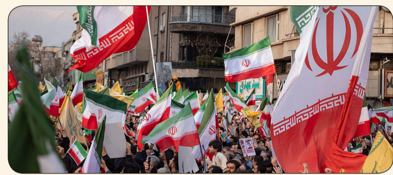
ಪ್ರತಿಕ್ರಿಯೆ ನೀಡಲಾಗುವುದು: ಇರಾನ್

ಇರಾನ್ ಈ ದಾಳಿಗಳನ್ನು ಖಂಡಿಸಿದ್ದು, ವಾಷಿಂಗ್ಟನ್ ಮತ್ತು ಟೆಹ್ರಾನ್ ನಡುವೆ ಜೂನ್‌ನಲ್ಲಿ ಸಹಿ ಹಾಕಲಾದ ಕದನ ವಿರಾಮ ಒಪ್ಪಂದದ ಉಲ್ಲಂಘನೆಯಾಗಿದೆ ಎಂದು ಕರೆದಿದೆ. "ಯುಎಸ್ ಆಡಳಿತವು ತನ್ನ ಬದ್ಧತೆಗಳಿಗೆ ಯಾವುದೇ ಮೌಲ್ಯವನ್ನು ನೀಡುವುದಿಲ್ಲ ಮತ್ತು ಭರವಸೆಗಳನ್ನು ಮುರಿಯುವುದು ಈ ಆಡಳಿತದ ಸ್ವಭಾವದ ಭಾಗವಾಗಿದೆ ಎಂದು ಇರಾನ್ ಮತ್ತೊಮ್ಮೆ ತೋರಿಸುತ್ತದೆ" ಎಂದು ಇರಾನ್ ವಿದೇಶಾಂಗ ಸಚಿವಾಲಯ ಹೇಳಿಕೆಯಲ್ಲಿ ತಿಳಿಸಿದೆ. "ಇರಾನ್ ಇಸ್ಲಾಮಿಕ್ ಗಣರಾಜ್ಯವು ಅಮೆರಿಕದ ಮಿಲಿಟರಿ ಆಕ್ರಮಣದ ವಿರುದ್ಧ ತನ್ನ ರಾಷ್ಟ್ರೀಯ ಸಾರ್ವಭೌಮತ್ವ ಮತ್ತು ಪ್ರಾದೇಶಿಕ ಸಮಗ್ರತೆಯನ್ನು ರಕ್ಷಿಸುವ ತನ್ನ ನಿರ್ಣಯವನ್ನು ಪ್ರನುಚ್ಛಿಸುತ್ತದೆ" ಎಂದು ಹೇಳಿಕೆಯಲ್ಲಿ ಸೇರಿಸಲಾಗಿದೆ. ಬಹ್ರೇನ್ ಮತ್ತು ಕುವೈತ್‌ನಲ್ಲಿರುವ ಅಮೆರಿಕದ ಸೌಲಭ್ಯಗಳ ಮೇಲಿನ ತನ್ನ ಪ್ರತಿರೋಧದ ದಾಳಿಗಳು ಅಮೆರಿಕದ ದಾಳಿಗೆ ಪ್ರತಿಕ್ರಿಯೆಯಾಗಿದೆ ಎಂದು ಐಆರ್‌ಎಸ್ ಹೇಳಿದೆ ಮತ್ತು ಅಮೆರಿಕದ ದಾಳಿಗಳು ಕದನ