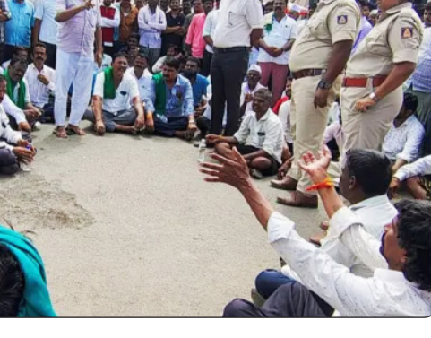
ಎಂಬ ಪ್ರಶ್ನೆಗಳು ಇದೀಗ ಉದ್ಭವಿಸಿವೆ. ಈ ದುರಂತ ಘಟನೆಯಿಂದ ಗ್ರಾಮದ ಜನರಲ್ಲಿ ಆಕ್ರೋಶಕ್ಕೆ ಕಾರಣವಾಗಿದ್ದು, ಲೈನ್‌ಮ್ಯಾನ್ ಸಾರ್ವಜನಿಕ ಕರ್ತವ್ಯ ಲೋಪವೇ ರೈತನ ಸಾವಿಗೆ ಕಾರಣ ಎಂದು ಗ್ರಾಮಸ್ಥರು ಆರೋಪಿಸಿ ಪ್ರತಿಭಟನೆ ನಡೆಸುತ್ತಿದ್ದಾರೆ. ವಿದ್ಯುತ್ ದುರಸ್ತಿ ಮಾಡುವಾಗ ಅಲ್ಲಿರುವ ಲೈನ್ ಮ್ಯಾನ್ ಎಲ್‌ಸಿ ತೆಗೆದಿರುವುದಾಗಿ ಆ ವ್ಯಕ್ತಿಗೆ ಹೇಳಿದ್ದಾರೆ. ಬಳಿಕ ಅದನ್ನು ನಂಬಿ ವಿದ್ಯುತ್ ಕಂಬ ಹತ್ತಿದ ರೈತ ತಂತಿ ಹಿಡಿದ