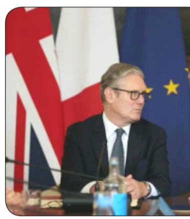
ಸಹಕರಿಸಲು ಒಮಾನ್ ಒಪ್ಪಿಕೊಂಡಿದೆ ಎಂದು ಎರಡೂ ದೇಶಗಳು ತಿಳಿಸಿವೆ. "ಒಮಾನ್ ಸುಲ್ತಾನರು ತನ್ನ ಸಾರ್ವಭೌಮ ಪ್ರಾದೇಶಿಕ ನೀರು ಸಂಚರಣೆಗೆ ಸುರಕ್ಷಿತವಾಗಿದೆ ಎಂದು ಐಚಿಪಡಿ ಸಿಕೊಳ್ಳಲು ಯುನೈಟೆಡ್ ಕಿಂಗ್‌ಡಂ ಮತ್ತು ಫ್ರಾನ್ಸ್‌ನೊಂದಿಗೆ ಕೆಲಸ ಮಾಡಲು ಒಪ್ಪಿಕೊಂಡಿದ್ದಾರೆ" ಎಂದು ಹೇಳಿಕೆಯಲ್ಲಿ ಸೇರಿಸಲಾಗಿದೆ. ಕಾರ್ಯತಂತ್ರದ ಜಲಮಾರ್ಗದ

ಪ್ಯಾರಿಸ್/ಲಂಡನ್, ಜುಲೈ 4: ಹಾರ್ಮುಜ್ ಜಲಸಂಧಿಯ ಮೂಲಕ ಸುರಕ್ಷಿತ ಸಂಚಾರವನ್ನು ಐಚಿಪಡಿ ಸಿಕೊಳ್ಳಲು ಫ್ರಾನ್ಸ್ ಮತ್ತು ಯುಕೆ ಒಮಾನ್ ಜೊತೆ ಜಂಟಿಯಾಗಿ ಕೆಲಸ ಮಾಡುವ ಯೋಜನೆಗಳನ್ನು ಘೋಷಿಸಿವೆ. ಇದು ಇರಾನ್‌ನ ಕೋರ್ಟ್‌ಗೆ ಕಾರಣವಾಗಿದೆ. ಇಂಟರ್ ನೆಷನಲ್ ರಿಲೇಷನ್ಸ್ ಮತ್ತು ಫ್ರಾನ್ಸ್ ಜಲಸಂಧಿಯನ್ನು ಜಾಗತಿಕ ವ್ಯಾಪಾರ ಮತ್ತು ಇಂಧನ ಪೂರೈಕೆಗೆ ನಿರ್ಣಾಯಕ ಮಾರ್ಗವೆಂದು ಕರೆದವು ಮತ್ತು ಎಲ್ಲಾ ರಾಷ್ಟ್ರಗಳ ಹಡಗುಗಳಿಗೆ ಸಂಚರಣೆಯ ಸ್ವಾತಂತ್ರ್ಯವನ್ನು ಖಾತರಿಪಡಿಸುವ ಆಗತ್ಯವನ್ನು ಒತ್ತಿಹೇಳಿದವು. "ಹಾರ್ಮುಜ್ ಜಲಸಂಧಿಯು ಜಾಗತಿಕ ಆರ್ಥಿಕತೆಗೆ ಪ್ರಮುಖ ಅಪಘನನಿಯಾಗಿದೆ. ಜಲಸಂಧಿಯ ಮೂಲಕ ಎಲ್ಲಾ ರಾಷ್ಟ್ರಗಳ ಹಡಗುಗಳಿಗೆ ಸುರಕ್ಷಿತ ಸಂಚರಣೆಯನ್ನು ಪುನಃಸ್ಥಾಪಿಸುವುದು ಜಾಗತಿಕ ಕಾಳಜಿಯ ವಿಷಯವಾಗಿದೆ" ಎಂದು ಹೇಳಿಕೆಯಲ್ಲಿ ತಿಳಿಸಲಾಗಿದೆ. ತನ್ನ ಪ್ರಾದೇಶಿಕ ನೀರಿನೊಳಗೆ ಸಂಚರಣೆಯ ಸುರಕ್ಷತೆಯನ್ನು ಐಚಿಪಡಿ ಸಿಕೊಳ್ಳುವ ಗುರಿಯನ್ನು ಹೊಂದಿರುವ ಪ್ರಯತ್ನಗಳಲ್ಲಿ