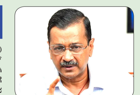
ಇ20 ಬಲವಂತ ಹೇರಿಕೆ: ಕೇಜ್ರಿವಾಲ್ ವಾಗ್ದಾಳಿ

ಇ20 ಬಲವಂತ ಹೇರಿಕೆ: ಕೇಜ್ರಿವಾಲ್ ವಾಗ್ದಾಳಿ ಇದಕ್ಕೂ ಮೊದಲು, ಆಮ್ ಆದ್ಮಿ ಪಕ್ಷದ (ಎಎಐ) ರಾಷ್ಟ್ರೀಯ ಸಂಚಾಲಕ ಅರವಿಂದ ಕೇಜ್ರಿವಾಲ್ ಕೂಡ, ಕೇಂದ್ರವು ಜನರ ಮೇಲೆ ಬಲವಂತವಾಗಿ ಇ20 ಪೆಟ್ರೋಲ್ ಹೇರುತ್ತಿದೆ. ಇದು ವಾಹನಗಳಿಗೆ ಹಾನಿಯನ್ನುಂಟುಮಾಡುತ್ತಿದೆ ಮತ್ತು ಇಂಧನ ದಕ್ಕತೆಯನ್ನು ಕಡಿಮೆ ಮಾಡುತ್ತಿದೆ ಎಂದು ದೂರಿದ್ದರು. ತಮ್ಮ ಎಕ್ಸ್‌ನಲ್ಲಿ ವಿಡಿಯೋ ಪೋಸ್ಟ್ ಹಂಚಿಕೊಂಡ ಕೇಜ್ರಿವಾಲ್, "ಇಡೀ ದೇಶವು ಮೋದಿ ಸರ್ಕಾರಕ್ಕೆ ಪ್ರಾಯೋಗಿಕ ಪ್ರಯೋಗಾಲಯವಾಗಿದೆ. ಎಥೆನಾಲ್‌ನಿಂದಾಗಿ ಜನರ ವಾಹನಗಳು ಕ್ಷುಣ್ಣಗೊಳ್ಳುತ್ತಿವೆ, ಬಿಡಿಭಾಗಗಳು ಹಾನಿಗೊಳಗಾಗುತ್ತಿವೆ ಮತ್ತು ಮೈಲೇಜ್ ಕುಸಿಯುತ್ತಿದೆ. ಜನರು ತೀವ್ರವಾಗಿ ಕೋಪಗೊಂಡಿದ್ದಾರೆ ಎಂದಿದ್ದಾರೆ. ಜನರು ಇದನ್ನು ವಿರೋಧಿಸುತ್ತಿರುವಾಗ, ನೀವು ಏಕೆ ಅವರ ಮೇಲೆ ಇದನ್ನು ಹೇರುತ್ತಿದ್ದೀರಿ? ಇದನ್ನು ಏಕೆ ಹಿಂಪಡೆಯುತ್ತಿಲ್ಲ? ನಿಮಗೆ ಮತ ನೀಡಿದವರು ಜನರೇ. ಅವರ ವಾಹನವು ಗೌರವಿಸುವುದು ಮತ್ತು ಅವರ ಮಾತನ್ನು ಆಲಿಸುವುದು ನಿಮ್ಮ ಕರ್ತವ್ಯ" ಎಂದಿದ್ದಾರೆ.