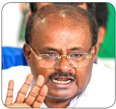
ಕೇಂದ್ರ ಚುನಾವಣಾ ಆಯೋಗಕ್ಕೆ ಕೇಂದ್ರ ಸಚಿವ ಎಚ್.ಡಿ. ಕುಮಾರಸ್ವಾಮಿ ಆಗ್ರಹ

ಬೆಂಗಳೂರು, ಜು.4: ಕರ್ನಾಟಕದಲ್ಲಿ ಇದುವರೆಗೂ ನಡೆದಿರುವ ಮತದಾರರ ಪಟ್ಟಿ ವಿಶೇಷ ಸಮಗ್ರ ಪರಿಷ್ಕರಣೆ(ಎಸ್‌ಐಆರ್) ಯನ್ನು ರದ್ದುಗೊಳಿಸಬೇಕು ಎಂದು ಕೇಂದ್ರದ ಬೃಹತ್ ಕೈಗಾರಿಕೆ ಹಾಗೂ ಉಕ್ಕು ಖಾತೆ ಸಚಿವ ಎಚ್.ಡಿ.ಕುಮಾರಸ್ವಾಮಿ ಭಾರತೀಯ ಚುನಾವಣಾ ಆಯೋಗವನ್ನು ಆಗ್ರಹಿಸಿದ್ದಾರೆ. ಸುದ್ದಿಗಾರರೊಂದಿಗೆ ಮಾತನಾಡಿದ ಅವರು, ಕರ್ನಾಟಕದಲ್ಲಿ ಈಗಾಗಲೇ ನಡೆದಿರುವ ಎಸ್‌ಐಆರ್‌ಗೆ ಯಾವುದೇ ಅರ್ಥವಿಲ್ಲ. ಕೆಲವೆಡೆ ಮನಮನೆಗೆ ತೆರಳಿ ಎಸ್‌ಐಆರ್ ಪ್ರಕ್ರಿಯೆ ಕೈಗೊಳ್ಳುವ ಬದಲು ಕಲ್ಯಾಣ ಮಂಟಪದಲ್ಲಿ ಗಣತಿ ನಮೂನೆಯನ್ನು ನೀಡಲಾಗುತ್ತಿದೆ. ಈ ಸಂಬಂಧ ರಾಜ್ಯ ಮುಖ್ಯ ಚುನಾವಣಾಧಿಕಾರಿಗಳಿಗೆ ಜಿಡಿಎಸ್ ವತಿಯಿಂದ ದೂರು ಸಲ್ಲಿಸಲಾಗಿದೆ. ಆದರೆ ಅವರು ಚುನಾವಣಾ ಆಯೋಗಕ್ಕೆ ಕಳುಹಿಸಿಕೊಟ್ಟಿದ್ದು, ಅವರ ನಿರ್ದೇಶನದಂತೆ ಕ್ರಮ ಕೈಗೊಳ್ಳುವುದಾಗಿ ಹೇಳಿದ್ದಾರೆ. ಸೋಮವಾರ ದೆಹಲಿಗೆ ತೆರಳಿ ಭಾರತೀಯ ಚುನಾವಣಾ ಆಯೋಗದ ಅಧ್ಯಕ್ಷರನ್ನು ಭೇಟಿ