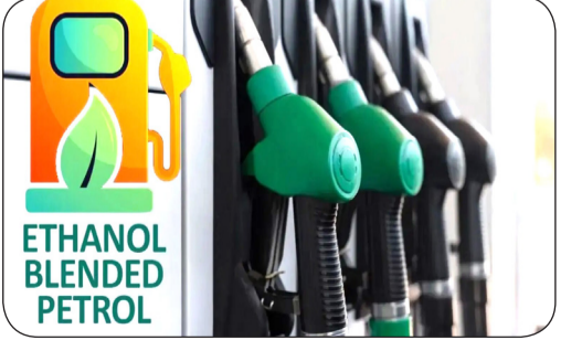
ಎಥೆನಾಲ್ ಮಿಶ್ರಣ ಮಾಡುವ ಈ ಪ್ರಯೋಗವು ಪಾರದರ್ಶಕತೆ, ವೈಜ್ಞಾನಿಕ ಪುರಾವೆಗಳು ಮತ್ತು ಗ್ರಾಹಕ ರಕ್ಷಣೆಯ ಬೆಂಬಲದೊಂದಿಗೆ ನಡೆಯಬೇಕು. ಅದೇನಿಗಿಲ್ಲದಿದ್ದರೆ ವಾಹನ ಚಾಲಕರ ವೆಚ್ಚದಲ್ಲಿ ಅಲ್ಲ, ಶೇ 20ರಷ್ಟು ಎಥೆನಾಲ್ ಮಿಶ್ರಣವಾಗಿದ್ದರೂ, ಇಂಧನ ಬೆಲೆಗಳು ಏಕೆ ಕಡಿಮೆಯಾಗಲಿಲ್ಲ ಎಂಬುದನ್ನು ಬಿಜೆಪಿ ಸರ್ಕಾರ ವಿವರಿಸಬೇಕು ಮತ್ತು ವಾಹನ ಬಳಕೆದಾರರ ಹೆಚ್ಚುತ್ತಿರುವ ಕಳವಳಗಳನ್ನು ಪರಿಹರಿಸಬೇಕು' ಎಂದು ಅವರು ಹೇಳಿದರು.

ಇ20 ಬಲವಂತ ಹೇರಿಕೆ: ಕೇಜ್ರಿವಾಲ್ ವಾಗ್ದಾಳಿ ಇದಕ್ಕೂ ಮೊದಲು, ಆಮ್ ಆದ್ಮಿ ಪಕ್ಷದ (ಎಎಐ) ರಾಷ್ಟ್ರೀಯ ಸಂಚಾಲಕ ಅರವಿಂದ ಕೇಜ್ರಿವಾಲ್ ಕೂಡ, ಕೇಂದ್ರವು ಜನರ ಮೇಲೆ ಬಲವಂತವಾಗಿ ಇ20 ಪೆಟ್ರೋಲ್ ಹೇರುತ್ತಿದೆ. ಇದು ವಾಹನಗಳಿಗೆ ಹಾನಿಯನ್ನುಂಟುಮಾಡುತ್ತಿದೆ ಮತ್ತು ಇಂಧನ ದಕ್ಕತೆಯನ್ನು ಕಡಿಮೆ ಮಾಡುತ್ತಿದೆ ಎಂದು ದೂರಿದ್ದರು. ತಮ್ಮ ಎಕ್ಸ್‌ನಲ್ಲಿ ವಿಡಿಯೋ ಪೋಸ್ಟ್ ಹಂಚಿಕೊಂಡ ಕೇಜ್ರಿವಾಲ್, "ಇಡೀ ದೇಶವು ಮೋದಿ ಸರ್ಕಾರಕ್ಕೆ ಪ್ರಾಯೋಗಿಕ ಪ್ರಯೋಗಾಲಯವಾಗಿದೆ. ಎಥೆನಾಲ್‌ನಿಂದಾಗಿ ಜನರ ವಾಹನಗಳು ಕ್ಷುಣ್ಣಗೊಳ್ಳುತ್ತಿವೆ, ಬಿಡಿಭಾಗಗಳು ಹಾನಿಗೊಳಗಾಗುತ್ತಿವೆ ಮತ್ತು ಮೈಲೇಜ್ ಕುಸಿಯುತ್ತಿದೆ. ಜನರು ತೀವ್ರವಾಗಿ ಕೋಪಗೊಂಡಿದ್ದಾರೆ ಎಂದಿದ್ದಾರೆ. ಜನರು ಇದನ್ನು ವಿರೋಧಿಸುತ್ತಿರುವಾಗ, ನೀವು ಏಕೆ ಅವರ ಮೇಲೆ ಇದನ್ನು ಹೇರುತ್ತಿದ್ದೀರಿ? ಇದನ್ನು ಏಕೆ ಹಿಂಪಡೆಯುತ್ತಿಲ್ಲ? ನಿಮಗೆ ಮತ ನೀಡಿದವರು ಜನರೇ. ಅವರ ವಾಹನವು ಗೌರವಿಸುವುದು ಮತ್ತು ಅವರ ಮಾತನ್ನು ಆಲಿಸುವುದು ನಿಮ್ಮ ಕರ್ತವ್ಯ" ಎಂದಿದ್ದಾರೆ.