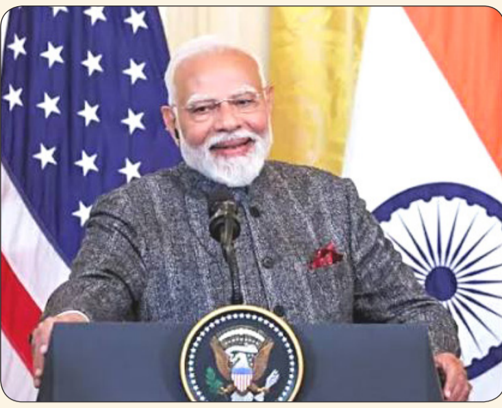
ಅಮೆರಿಕದ ಟೆಕ್ನಾಲಜಿ (ಒಇಇಐ) ನಂತರ ಉಪಕ್ರಮಗಳ ಮೂಲಕ ಎರಡೂ ದೇಶಗಳು ಸಹಯೋಗವನ್ನು ತೀವ್ರಗೊಳಿಸಿವೆ. ಇದು ಅವರ ಬೆಳೆಯುತ್ತಿರುವ ಕಾರ್ಯತಂತ್ರದ ಜೋಡಣೆಯನ್ನು ಒತ್ತಿಹೇಳುತ್ತದೆ. 1776 ರಲ್ಲಿ ಸ್ವಾತಂತ್ರ್ಯ ಘೋಷಣೆಯನ್ನು ಅಂಗೀಕರಿಸಿದ 250 ವರ್ಷಗಳನ್ನು ಸ್ಮರಿಸುವ ಮೂಲಕ ಅಮೆರಿಕ ದೇಶಾದ್ಯಂತ ಆಚರಣೆಗಳೊಂದಿಗೆ ಮೈಲಿಗಲ್ಲು ವಾರ್ಷಿಕೋತ್ಸವವನ್ನು ಆಚರಿಸಿತು.

ಪಾಲುದಾರಿಕೆಗಿಂತ ಹೆಚ್ಚಿನದನ್ನು ಹಂಚಿಕೊಳ್ಳುತ್ತವೆ. ಪ್ರಜಾಪ್ರಭುತ್ವ, ಕಾನೂನಿನ ನಿಯಮ ಮತ್ತು ನಮ್ಮ ಜನರ ಅಪರಿಮಿತ ಸಾಮರ್ಥ್ಯದಲ್ಲಿನ ನಮ್ಮ ಹಂಚಿಕೆಯ ನಂಬಿಕೆ ನಮ್ಮ ಸ್ನೇಹವನ್ನು ಜಾಗತಿಕ ಒಳಿತಿಗಾಗಿ ಒಂದು ಶಕ್ತಿಯನ್ನಾಗಿ ಮಾಡುತ್ತದೆ" ಎಂದು ಅವರು ಹೇಳಿದರು. "ಮುಂದಿನ 250 ವರ್ಷಗಳು ಅಮೆರಿಕಕ್ಕೆ ಇನ್ನೂ ಹೆಚ್ಚಿನ ಸಮೃದ್ಧಿ, ಶಾಂತಿ ಮತ್ತು ಪ್ರಗತಿಯನ್ನು ತರಲಿ ಮತ್ತು ಭಾರತ-ಯುಎಸ್ ಪಾಲುದಾರಿಕೆಯನ್ನು ಹೊಸ ಎತ್ತರಕ್ಕೆ ಕೊಂಡೊಯ್ಯಲಿ" ಎಂದು ಹೇಳುತ್ತಾ, ಈ ಪಾಲುದಾರಿಕೆ ಇನ್ನಷ್ಟು ಬಲಗೊಳ್ಳುತ್ತದೆ ಎಂಬ ವಿಶ್ವಾಸವನ್ನು ಮೋದಿ ವ್ಯಕ್ತಪಡಿಸಿದರು. ನವದೆಹಲಿ ಮತ್ತು ವಾಷಿಂಗ್ಟನ್ ರಕ್ಷಣೆ, ವ್ಯಾಪಾರ, ನಿರ್ಣಾಯಕ ಮತ್ತು ಉದ್ಯೋಗನುಖ ತಂತ್ರಜ್ಞಾನಗಳು, ಶುದ್ಧ ಇಂಧನ, ಬಾಹ್ಯಾಕಾಶ, ಶಿಕ್ಷಣ ಮತ್ತು ಜನರಿಯದ ಜನರಿಗೆ ವಿನಿಮಯ ಸೇರಿದಂತೆ ವ್ಯಾಪಕ ಶ್ರೇಣಿಯ ಕ್ಷೇತ್ರಗಳಲ್ಲಿ ಸಹಕಾರವನ್ನು ವಿಸ್ತರಿಸುತ್ತಿರುವ ಸಮಯದಲ್ಲಿ ಪ್ರಧಾನಿಯವರ ಸಂದೇಶ ಬಂದಿದೆ. ಕ್ಯಾಡ್ ಮತ್ತು ಇನಿಶಿಯೇಟಿವ್ ಆನ್ ಕ್ರಿಟಿಕಲ್ ಅಂಡ್