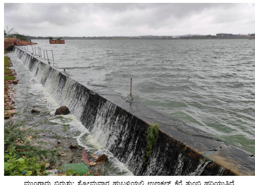
ಮುಂಗಾರು ಬಿರುಸು: ಸೋಮವಾರ ಹುಬ್ಬಳ್ಳಿಯಲ್ಲಿ ಉಣಕಲ್ ಕೆರೆ ತುಂಬಿ ಹರಿಯುತ್ತಿದೆ.