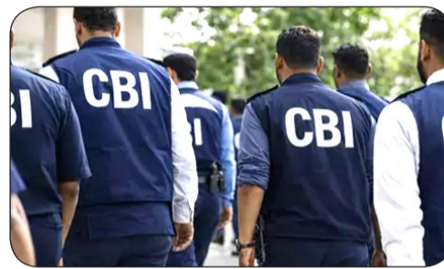
ಹೆಸರಿನಲ್ಲಿ ಪಾವತಿಗಳನ್ನು ಬಿಡುಗಡೆ ಮಾಡುವಲ್ಲಿ ಅಕ್ರಮಗಳು ನಡೆದಿವೆ ಎಂದು ಆರೋಪಿಸಲಾದ ಪ್ರಕರಣಗಳಿಗೆ ಸಂಬಂಧಿಸಿದಂತೆ ಸಿಬಿಐ ಹಿರಿಯ ಅಧಿಕಾರಿಯೊಬ್ಬರು ತಿಳಿಸಿದ್ದಾರೆ. ಬಿಆರ್‌ಪಿ ಸಾಂಕ್ರಮಿಕ ಅಧಿಕಾರಿಗಳ ಮಂಡಳಿಯು

ನವದೆಹಲಿ, ಜುಲೈ 6: ಗಡಿ ರಸ್ತೆ ಸಂಸ್ಥೆ (ಬಿಆರ್‌ಪಿ) ಯಲ್ಲಿನ ನಿಧಿ ದುರುಪಯೋಗಕ್ಕೆ ಸಂಬಂಧಿಸಿದ ನಾಲ್ಕು ಕ್ರಿಮಿನಲ್ ಪ್ರಕರಣಗಳಿಗೆ ಸಂಬಂಧಿಸಿದಂತೆ, ಜಮ್ಮು ಮತ್ತು ಕಾಶ್ಮೀರ, ಲಡಾಖ್, ದೆಹಲಿ, ಹರಿಯಾಣ, ಉತ್ತರಾಖಂಡ, ಉತ್ತರ ಪ್ರದೇಶ, ಬಿಹಾರ, ಮಹಾರಾಷ್ಟ್ರ, ಆಸ್ಸಾಂ, ಅರುಣಾಚಲ ಪ್ರದೇಶ ಮತ್ತು ನಾಗಾಲ್ಯಾಂಡ್ ಸೇರಿದಂತೆ 11 ರಾಜ್ಯಗಳು ಮತ್ತು ಕೇಂದ್ರಾಡಳಿತ ಪ್ರದೇಶಗಳ 26 ಸ್ಥಳಗಳಲ್ಲಿ ಸೋಮವಾರ ಕೇಂದ್ರ ತನಿಖಾ ದಳ ದಾಳಿ ನಡೆಸಿದೆ. ಶೋಧನೆಗಳ ಸಮಯದಲ್ಲಿ ಹಲವಾರು ಅಪರಾಧ ದಾಖಲೆಗಳು ಮತ್ತು ಡಿಜಿಟಲ್ ಪುರಾವೆಗಳನ್ನು ವಶಪಡಿಸಿ ಕೊಳ್ಳಲಾಗಿದೆ. ತನಿಖೆ ಮುಂದುವರಿದಿದೆ. ಕೇಂದ್ರಾಡಳಿತ ಪ್ರದೇಶ ಲಡಾಖ್‌ನಲ್ಲಿ ಪ್ರಾಜೆಕ್ಟ್ ವಿಜಯ್ ಮತ್ತು ಪ್ರಾಜೆಕ್ಟ್ ಯೋಜನೆ ಅಡಿಯಲ್ಲಿ ನಕಲಿ ಕ್ಯಾಶಿಯಲ್ ಕಾರ್ಡ್‌ಗಳ