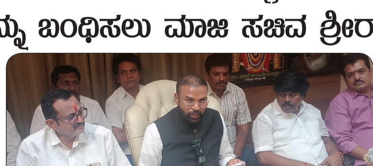
ಕೆಲಸ ನಡೆದಿದೆ. ಅದಕ್ಕಾಗಿ ಈವರೆಗೆ ಎಸ್ ಐ ಆರ್ ಪ್ರಕ್ರಿಯೆ ರದ್ದು ಮಾಡಿ ಚುನಾವಣಾ ಆಯೋಗ ಮಧ್ಯ ಪ್ರವೇಶ ಮಾಡಿ ಕಟ್ಟು ನಿಟ್ಟಿನಲ್ಲಿ ಆಗಬೇಕು ಎಂದು. ಅಕ್ರಮ ಬಾಂಗ್ಲಾ ವಲಸಿಗರು ಪಶ್ಚಿಮ ಬಂಗಾಳ, ಬಿಹಾರ ಮುಂತಾದ ರಾಜ್ಯಗಳಿಂದ ಹೊರ ಬಿದ್ದವರು ಈಗ ಕರ್ನಾಟಕದಲ್ಲಿ ಅಕ್ರಮಪಡೆದಿದ್ದು, ಅವರಿಗೆ ಕಾಂಗ್ರೆಸ್ ವಾಸ್ತವ್ಯ ನೀಡುತ್ತಿರುವ ಆರೋಪಿಸಿದರು.

ಬಳ್ಳಾರಿ, ಜು.6: ಮನೆ ಮನೆಗೆ ಹೋಗದೆ, ಎಲ್ಲರಲ್ಲಿ ಮನೀಡ್, ಶಾದಿ ಮಹಲ್, ದರ್ಗಾ, ಮದರಸಾ, ಮೊಹಲ್ಲಾಗಳಲ್ಲಿ ಗುಂಪಾಗಿ ಕುಳಿತು, ಮತದಾರರ ಪಟ್ಟಿ ಸಮಗ್ರ ಪರಿಷ್ಕರಣೆ (ಎಸ್‌ಐಆರ್)ಯ ಅನುಮರೇಷನ್ ಪಾರಂಕುಲಬುತ್ತಿದ್ದಾರೆ. ಇದು ನಿರಾಯಾಸಕ ಉದ್ದೇಶವಲ್ಲ ಎಂದು ಅಧಿಕಾರಿಗಳಿಗೆ ಇದರಲ್ಲಿ ಪಾಲ್ಗೊಂಡ ಬಿಎಲ್‌ಓಗಳನ್ನು ತಕ್ಷಣ ಬಂಧಿಸಬೇಕು. ನಗರದ ತಮ್ಮ ನಿವಾಸದಲ್ಲಿ ಸುದ್ದಿ ಗೋಷ್ಠಿಯಲ್ಲಿ ಮಾತನಾಡುತ್ತಿದ್ದರು. ರಾಜ್ಯದಲ್ಲಿ ಮುಖ್ಯ ಮಂತ್ರಿ ಡಿ.ಕೆ.ಶಿವಕುಮಾರ್ ಆರೇತಿಯಂತೆ ಎಸ್ ಐ ಆರ್ ನಡೆಸುತ್ತಿರುವ ಅಧಿಕಾರಿಗಳು ಅವರು ಹೇಳಿದಂತೆ ಮಾಡುತ್ತಿದ್ದಾರೆ ಎಂದು ಮಾಜಿ ಸಚಿವ ಶ್ರೀರಾಮುಲು ಆರೋಪಿಸಿದ್ದಾರೆ.