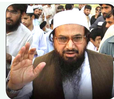
ಯುದ್ಧ ನಡೆಸಿದ್ದಕ್ಕಾಗಿ ಮತ್ತು ಗಡಿಯಾಚೆಯಿಂದ ಪಿತೂರಿ ರೂಪಿಸಿದ್ದಕ್ಕಾಗಿ ಆರೋಪಗಳ ಮಿರುದ್ಧ ಎನ್‌ಐಎ ದಂಡನಾ ವಿಭಾಗವನ್ನು ಆರೋಪಪತ್ರದಲ್ಲಿ ಉಲ್ಲೇಖಿಸಿದೆ. ಮೂಲ 1,597 ಪುಟಗಳ ಜಾರ್ಜ್‌ಶೀಟ್‌ನ ಮುಂದುವರಿದ ಭಾಗವಾಗಿ ಸಲ್ಲಿಸಲಾದ ಜಾರ್ಜ್‌ಶೀಟ್, ಪಾಕಿಸ್ತಾನದ ಪಿತೂರಿ, ಹಫೀಜ್ ಸಯೀದ್ ಪಾತ್ರ ಮತ್ತು ಪ್ರಕರಣದಲ್ಲಿ ಎನ್‌ಐಎ ಸಂಗ್ರಹಿಸಿದ ಪೋಷಕ ಸಾಕ್ಷ್ಯಗಳ ವಿವರಗಳನ್ನು

ನವದೆಹಲಿ, ಜುಲೈ 6: ಪಹಲ್ನಾಮ್ ಭಯೋತ್ಪಾದಕ ದಾಳಿ ಪ್ರಕರಣದಲ್ಲಿ ಪಾಕಿಸ್ತಾನ ಮೂಲದ ಭಯೋತ್ಪಾದಕ ಮತ್ತು ಎಲ್‌ಇಟಿ/ಟಿಆರ್‌ಎಫ್ ಮುಖ್ಯಸ್ಥ ಮತ್ತು ಸ್ಥಾಪಕ ಹಫೀಜ್ ಸಯೀದ್ ಮಿರುದ್ಧ ರಾಷ್ಟ್ರೀಯ ತನಿಖಾ ಸಂಸ್ಥೆ (ಎನ್‌ಐಎ) ಸೋಮವಾರ ಆರೋಪಗಳನ್ನು ದಾಖಲಿಸಿದೆ. ಜಮ್ಮುಖಂಡ್‌ನ ಎನ್‌ಐಎ ವಿಶೇಷ ನ್ಯಾಯಾಲಯಕ್ಕೆ ಸಲ್ಲಿಸಲಾದ ಪೂರಕ ಆರೋಪಪತ್ರದಲ್ಲಿ, ಭಯೋತ್ಪಾದನಾ ನಿಗ್ರಹ ಸಂಸ್ಥೆ ಹಫೀಜ್ ಸಯೀದ್ ಮಿರುದ್ಧ ವೈಯಕ್ತಿಕವಾಗಿ ಮತ್ತು ನಿಷೇಧಿತ ಲಕ್ಷ್ಮಣ್-ಎ-ತೂಯ್ಯಾ (ಎಲ್‌ಇಟಿ) ಭಯೋತ್ಪಾದಕ ಸಂಘಟನೆ ಮತ್ತು ಅದರ ಸಕ್ರಿಯ ಪ್ರಾಸಿಕ್ಯೂಟರ್ ಸಂಘಟನೆ ದಿ ರೆಸಿಸ್ಟೆನ್ಸ್ ಫ್ರಂಟ್ (ಟಿಆರ್‌ಎಫ್) ಮುಖ್ಯಸ್ಥನಾಗಿಯೂ ಆರೋಪ ಹೊರಿಸಿದೆ. ಆರೋಪಿಯ ಮಿರುದ್ಧ ಬಿಎನ್‌ಎಸ್, 2023 ಮತ್ತು ಕಾನೂನುಬಾಹಿರ ಚಟುವಟಿಕೆಗಳು (ತಡೆಗಟ್ಟುವಿಕೆ) ಕಾಯ್ದೆ 1967 ರ ವಿವಿಧ ವಿಭಾಗಗಳ ಅಡಿಯಲ್ಲಿ ಆರೋಪ ಹೊರಿಸಲಾಗಿದೆ. ಭಾರತದ ಮಿರುದ್ಧ