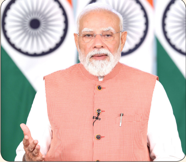
ಅಚಲ ಬದ್ಧತೆಯಿಂದ ಎಂದೂ ಪ್ರಧಾನಿ ಹೇಳಿದರು. ಮುಖರ್ಜಿ ವ್ಯಾಖ್ಯಾನಿಸಲಾಗಿದೆ. ಅವರು ಭಾರತದ ಏಕತೆ, ಘನತೆ ಮತ್ತು ಪ್ರಗತಿಗಾಗಿ ತಮ್ಮನ್ನು ತಾವು ಅರ್ಪಿಸಿಕೊಂಡರು"

ನವದೆಹಲಿ, ಜುಲೈ 6: ಶ್ಯಾಮ ಪ್ರಸಾದ್ ಮುಖರ್ಜಿ ಅವರ 125 ನೇ ಜನ್ಮ ದಿನಾಚರಣೆಯಂದು ಪ್ರಧಾನಿ ನರೇಂದ್ರ ಮೋದಿ ಸೋಮವಾರ ಅವರಿಗೆ ಗೌರವ ಸಲ್ಲಿಸಿದರು. ಶಿಕ್ಷಣ, ಕೈಗಾರಿಕೆ, ಮಾನವೀಯ ಸೇವೆ ಮತ್ತು ರಾಷ್ಟ್ರೀಯ ಏಕತೆಗೆ ನೀಡಿದ ಕೊಡುಗೆಗಳ ಅಭಿವೃದ್ಧಿ ಹೊಂದಿದ ಭಾರತದತ್ತ ದೇಶದ ಪ್ರಗತಿಗೆ ಪ್ರೇರಣೆ ನೀಡುತ್ತಿವೆ ಎಂದು ಭಾರತದ ಅಗ್ರಗಣ್ಯ ರಾಷ್ಟ್ರನಿರ್ಮಾಣಕಾರರಲ್ಲಿ ಒಬ್ಬರು ಎಂದು ಬಣ್ಣಿಸಿದರು. "ಇಂದು, ಡಾ. ಶ್ಯಾಮಪ್ರಸಾದ್ ಮುಖರ್ಜಿ ಅವರ 125ನೇ ಜಯಂತಿಯಂದು, ಭಾರತದ ಅತ್ಯಂತ ಗಮನಾರ್ಹ ರಾಷ್ಟ್ರನಿರ್ಮಾಣಕಾರರಲ್ಲಿ ಒಬ್ಬರಿಗೆ ನಾನು ನಮಸ್ಕರಿಸುತ್ತೇನೆ, ಅವರ ಜೀವನವನ್ನು ಪಾಂಡಿತ್ಯ, ಧೈರ್ಯ ಮತ್ತು ರಾಷ್ಟ್ರೀಯ ಸೇವೆಗೆ