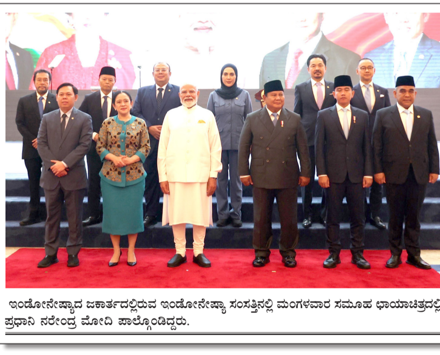
ಇಂಡೋನೇಷ್ಯಾದ ಜಕಾರ್ತಾದಲ್ಲಿರುವ ಇಂಡೋನೇಷ್ಯಾ ಸಂಸತ್ತಿನಲ್ಲಿ ಮಂಗಳವಾರ ಸಮೂಹ ಛಾಯಾಚಿತ್ರದಲ್ಲಿ ಪ್ರಧಾನಿ ನರೇಂದ್ರ ಮೋದಿ ಪಾಲ್ಗೊಂಡಿದ್ದರು.