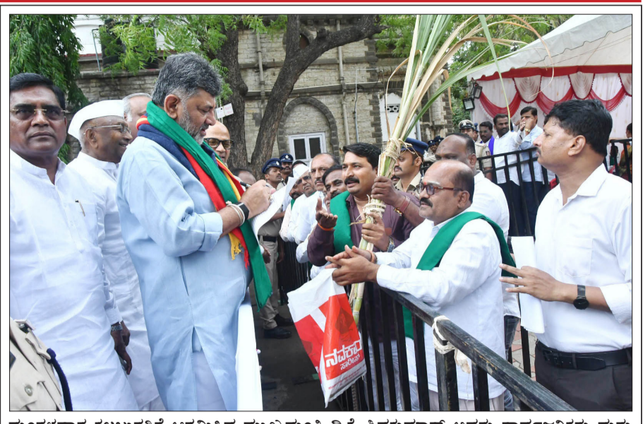
ಮಂಗಳವಾರ ಕಲಬುರಗಿ ಅಗಮಿಸಿದ ಮುಖ್ಯಮಂತ್ರಿ ಡಿ.ಕೆ. ಶಿವಕುಮಾರ್ ಅವರು ಸಾರ್ವಜನಿಕ ಮತ್ತು ರೈತರ ಅಹವಾಲುಗಳನ್ನು ಸ್ವೀಕರಿಸಿದರು.