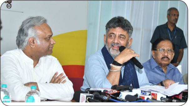
ನಗರಾಭಿವೃದ್ಧಿ ಸಚಿವಾಲಯದ ಅಧ್ಯಕ್ಷರಾದ ಡಿ.ಕೆ. ಶಿವಕುಮಾರ್ ಅವರ ಸಭೆಯಲ್ಲಿ.

ನಗರಾಭಿವೃದ್ಧಿ ಸಚಿವಾಲಯದಿಂದ ಅಗತ್ಯ ತಿದ್ದುಪಡಿ ಮಾಡಲಾಗುವುದು: ಸಿಎಂ ಡಿ.ಕೆ. ಶಿವಕುಮಾರ್ ಕಲಬುರಗಿ, ಜು.7: ನಗರಗಳತ್ತ ಜನರು ವಲಸೆ ಹೋಗುವುದನ್ನು ತಪ್ಪಿಸಲು ಎರಡು ಹಾಗೂ 3ನೇ ಹಂತದ ನಗರಗಳಲ್ಲಿ ಉದ್ಯಮಗಳ ಸೃಷ್ಟಿಗೆ ಉತ್ತೇಜನ ನೀಡಲು ಸರ್ಕಾರ ತೀರ್ಮಾನಿಸಿದೆ. ಜತೆಗೆ ಗ್ರಾಮೀಣ ಭಾಗಗಳಲ್ಲಿ ಗುಣಮಟ್ಟದ ತಿಕ್ಕಣ ನೀಡಲು ಸಿಎಸ್‌ಆರ್ ಶಾಲೆಗಳ ನಿರ್ಮಾಣಕ್ಕೆ ಒತ್ತು ನೀಡುತ್ತಿದೆ ಎಂದು ಸಿಎಂ ಡಿ.ಕೆ. ಶಿವಕುಮಾರ್ ಹೇಳಿದರು. ಕಲಬುರಗಿಯಲ್ಲಿ ವಿಭಾಗ ಮಟ್ಟದ ಪ್ರಗತಿ ಪರಿಶೀಲನಾ ಸಭೆ ಬಳಿಕ ಸುದ್ದಿಗೋಷ್ಠಿಯಲ್ಲಿ ಮಾತನಾಡಿ, ಉದ್ಯೋಗ ಸೃಷ್ಟಿಸಲು ಉದ್ಯಮಗಳ ಆಕರ್ಷಣೆಗೆ ಕ್ರಮ. ಎರಡು ಹಾಗೂ