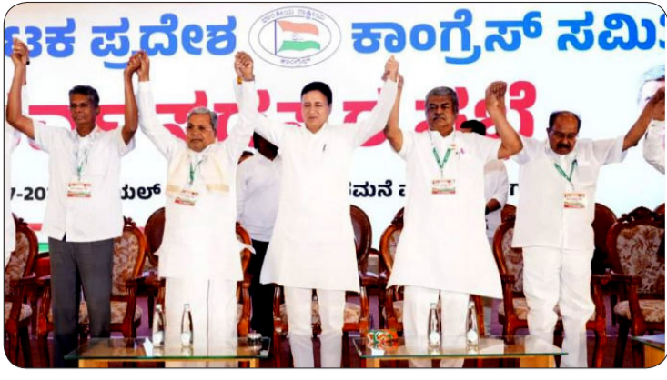
ಬಿಜೆಪಿ ಪಕ್ಷದ ಅಧ್ಯಕ್ಷರಾದ ಬಿ.ಕೆ.ಹರಿಪ್ರಸಾದ್ ಅವರ ಅಧ್ಯಕ್ಷತೆಯಲ್ಲಿ ನಡೆದ ಕಾರ್ಯಕಾರಿ ಸಮಿತಿ ಸಭೆಯಲ್ಲಿ ಕೆಪಿಸಿಸಿ ನಾಯಕರುಗಳು.